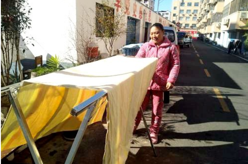
共享晾晒架让居民“晒”出了幸福感

“晾晒衣被看起来是很小的事情,却是家家户户都需要的,特别是一些一楼住户,多数是没有阳台的,涉及这么多居民,小事儿就不小了。”建安粮