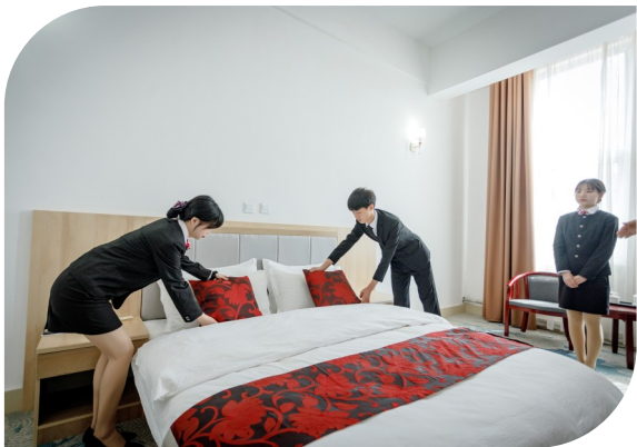
客房中式铺床赛项练习展示