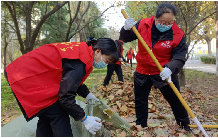
鹏辉物业党员志愿者在清扫落叶

本报讯（记者 秦水森 通讯员 何丽娜 文/图）11月15日上午，鹏辉物业党支部组织党员先锋队到公司管理的“城乡一体化示范区饮马河管养项目”，与项目工作人员共同协作清理落叶，巩固文明城市创建成果。