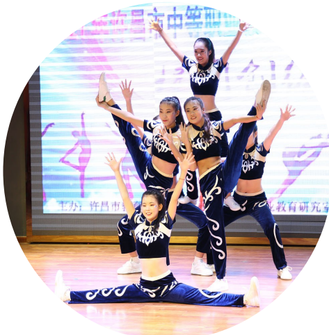
校园舞编创赛项展示

查找了不足。可以说，技能竞赛已经成为该校提升学生自主学习能力、增强创新能力、培育应用型人才的有效途径。