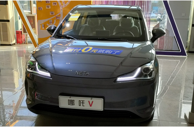
图为哪吒新能源汽车许昌宝地体验中心展出的哪吒V

中心了解到，哪吒汽车日前公布了10月份品牌销量，当月共交付车辆8107辆，同比增长294%。今年前10个月，哪吒汽车累计交付新车49534辆，同比增长398%。