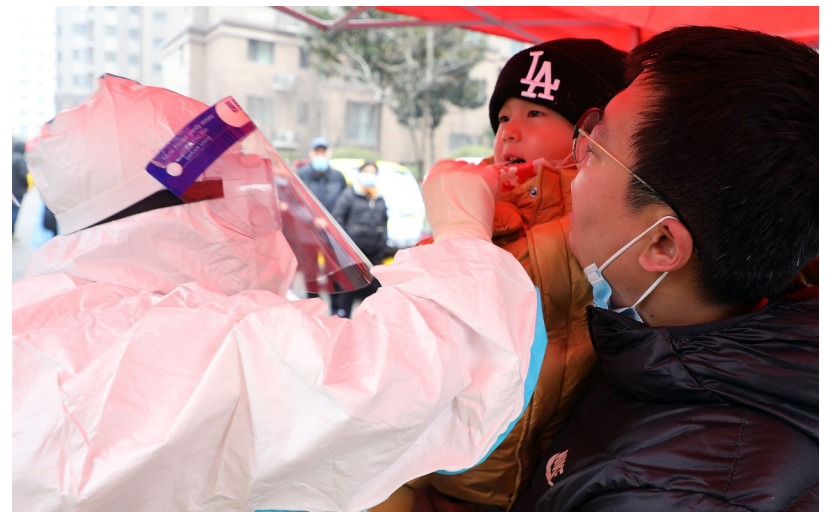
1月6日，医务工作者正在许昌恒达·名门尚居小区为居民做核酸检测采样。当日，我市启动全员核酸检测，进一步阻断疫情。