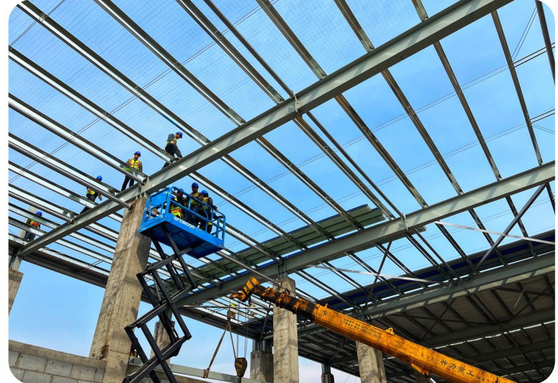
2月22日，建筑工人在许昌安彩新能科技有限公司年产4800万平方米光伏轻质基板项目的厂房施工现场紧张有序地作业。

高端化延伸的关键一环。 范耀江告诉记者，下一步，他们还将积极引进电池边框、银粉银浆、高纯度电子试剂等辅材项目，持续做大光伏电池、电池组件产业规模，打造“硅烷—颗粒硅—单晶硅片—太阳能电池片—光伏电站”的完整产业链条，力争成为全省光伏新能源产业基地。 延链补链强链，是襄城县发展壮大特色产业的不二法门。在河南首恒新材料有限公司生产调度指挥中心，工人正在认真操控控制台，有条不紊地进行生产作业。 “我们公司年产20万吨环己酮项目，主要是利用首山化工公司生产的氢气、苯等原料，采用首山化工干熄焦余热蒸汽，年产环己酮20万吨。”河南首恒新材料有限公司副总经理于新功说，目前，该项目已投料试车，可实现年收入16亿元、利税2亿元。 近年来，襄城县与平煤神马集团合作，发展循环经济，不断补链强链，初步形成了“焦炉煤气—粗苯—环己酮、己二酸、己二胺—尼龙66”产业链，逐步放大尼龙产业的规模效应。 发展是解决一切问题的总钥匙，项目是发展的第一载体。襄城县围绕产业链布局创新链、围绕创新链布局产业链，持续延链、补链、强链，实现了从煤炭“黑色经济”到煤化工“循环经济”、再到实现硅碳新材料“绿色经济”的蝶变。 许昌金萌新能源1GW高效太阳能光伏电池组件项目，投资5亿元，