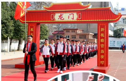
▲许昌高中学生跨越“龙门”

编者按:高考,是当下中国最受关注的考试。对国家来说,它是选拔人才的机制,是公平正义的体现;对个人来说,它是人生的转折,是改变命运的良机。时下,距离2022年高考仅有3个月,市直高中纷纷举行高三年级高考百日誓师大会,以鼓励学子,激发斗志。