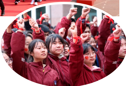
►市三高学生宣誓