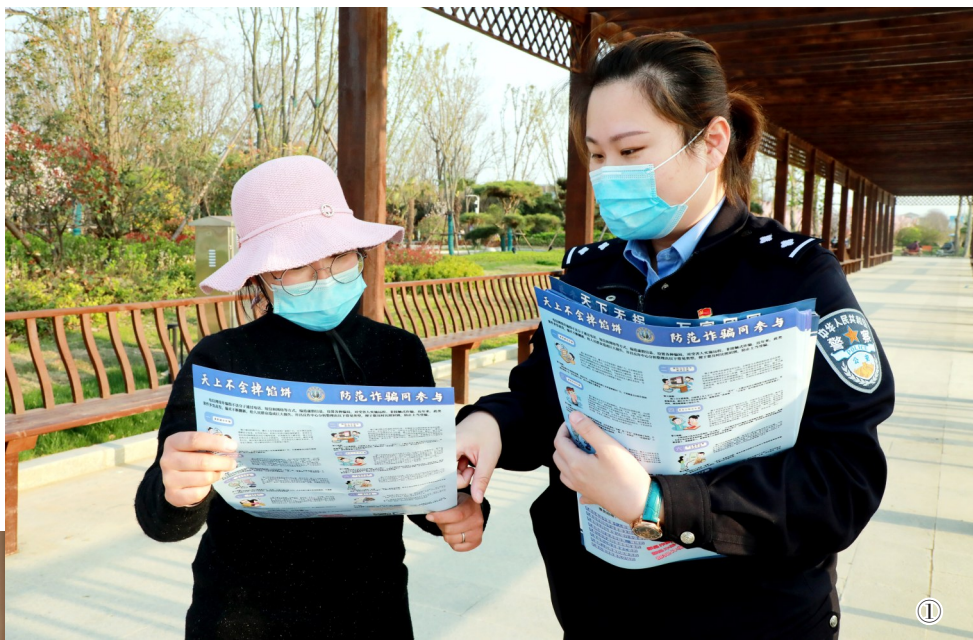
① 4月5日,鄢陵县公安局民警走进游园、走上街头,开展反诈宣传。民警发放宣传彩页,给群众讲解防骗知识。

清明节假期,我市公安机关紧密结合工作实际,坚持科学布警,最大限度将警力投向街面,强化在重点区域、路段的巡逻值守,切实提高街面见警率、管事率。广大民警、辅警统筹安排社会面管控、安全监管、疫情防控、交通秩序维护等重点工作,以强烈的使命感和责任担当投身一线,保证了清明节假期全市社会大局的持续稳定。