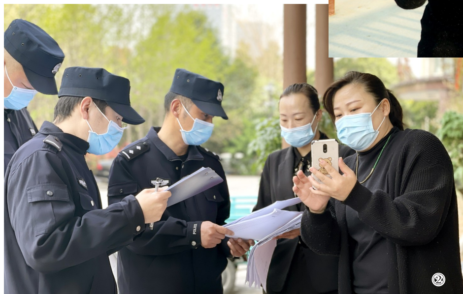
② 4月4日,许昌市公安局东城分局天宝派出所民警、辅警深入辖区内重点场所及重点区域检查疫情防控工作落实情况。