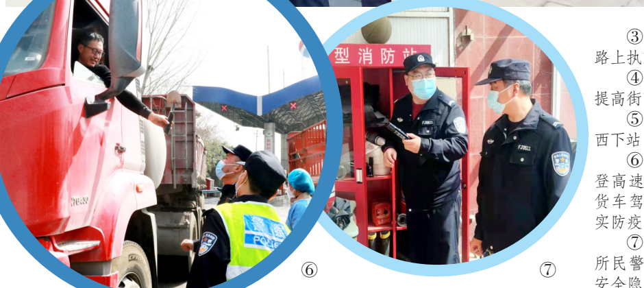
⑥ 4月3日,禹州市公安局民警在永登高速公路禹州茨庄站执勤,检查过往货车驾驶员的行程信息,提醒驾驶员落实防疫措施。