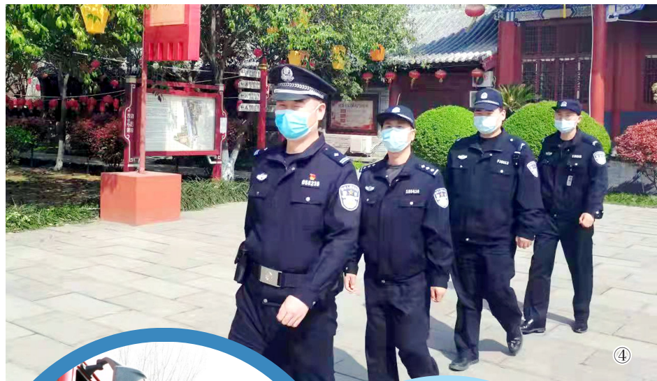
④ 假期期间,许昌市公安局魏都分局民警加大重点部位巡逻值守力度,提高街面见警率。图为4月3日,该分局民警在灞陵公园附近巡逻。