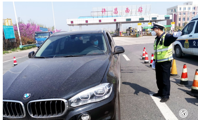
⑤ 4月3日,许昌市建安区公安局交通管理大队民警在永登高速公路许昌西下道口引导过往车辆,对驾驶员的行程信息、健康码等进行检查。