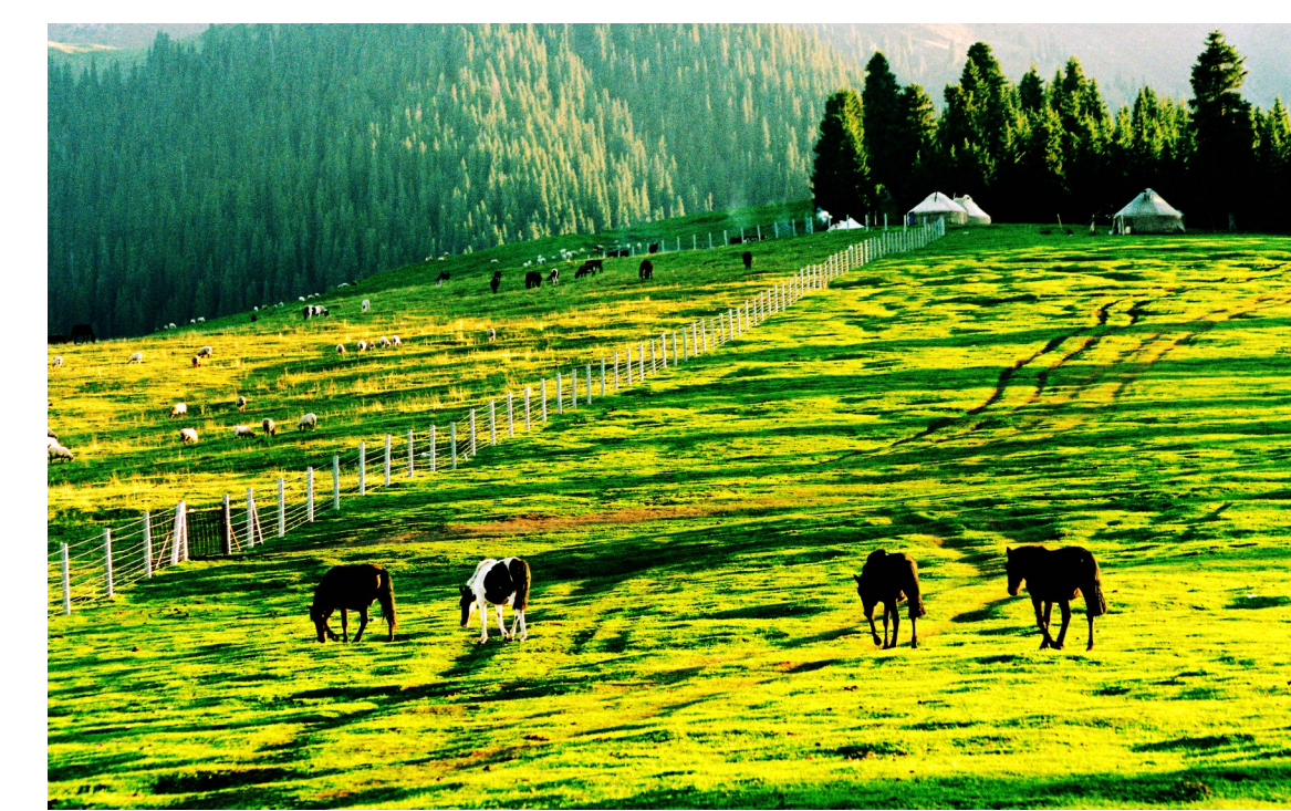
草原春色

时下太流行那句，“愿有人问你粥可温，有人为你立黄昏。”我想，以前索取了那么多，得到了那么多，接受了那么多，下半年，可以试着做个粥一样的人了。