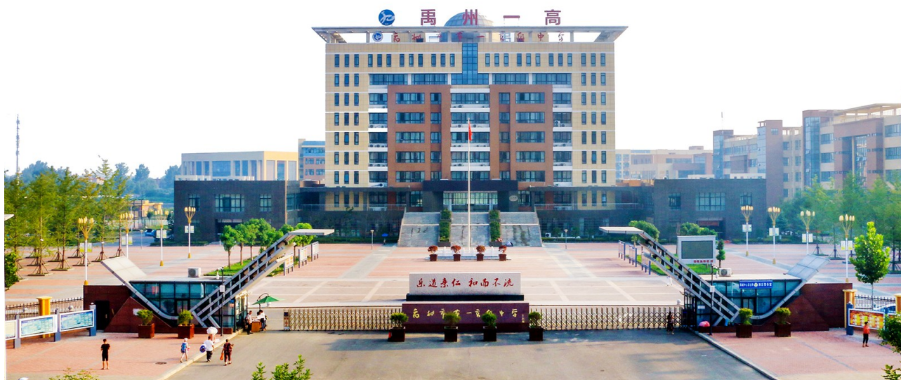
团结奋进的禹州一高