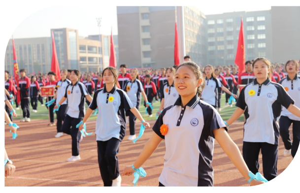
丰富多彩的校园文化活动