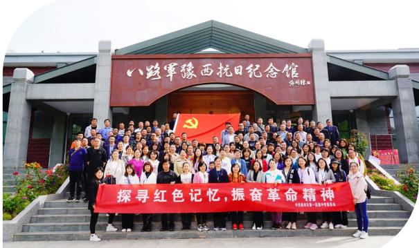
开展红色革命教育

禹州一高依托“三立一创”党建主题教育馆,打造学校精神宣传高地。在2021年许昌市党建观摩评比中,该校获得了许昌市第二名、禹州市第一名的好成绩。