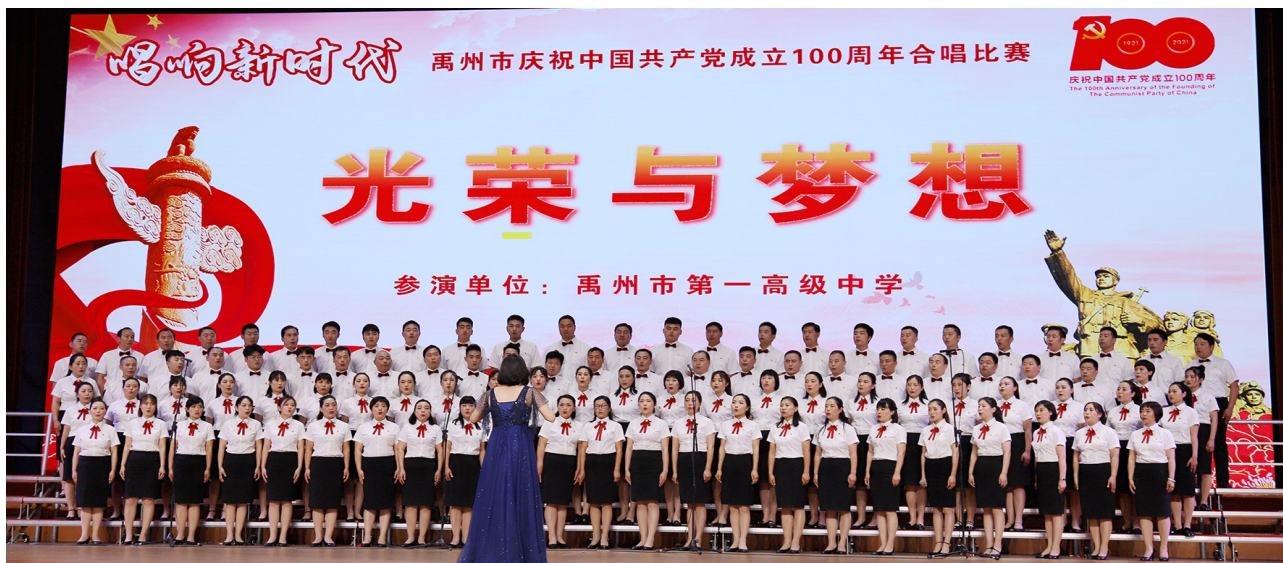
庆祝建党100周年合唱比赛