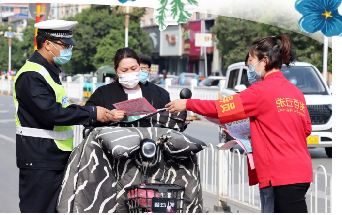
4月22日,鄢陵县公安局交通管理大队民警在辖区重点路段开展交通安全主题宣传活动,把酒驾、醉驾有关知识送到群众身边。