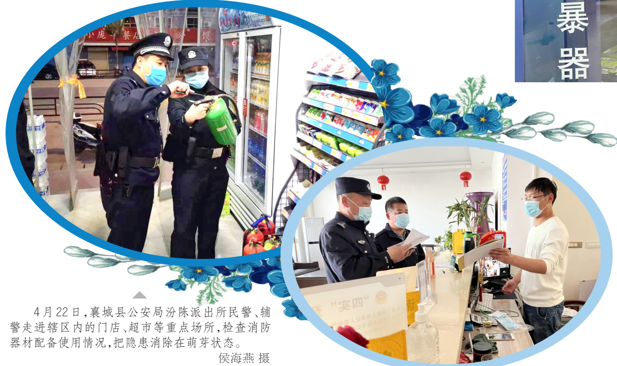
4月22日,襄城县公安局汾陈派出所民警、辅警走进辖区内的门店、超市等重点场所,检查消防器材配备使用情况,把隐患消除在萌芽状态。侯海燕 摄