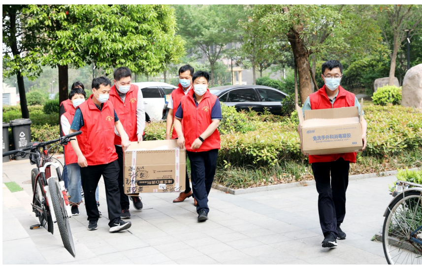
4月26日,许昌市人民检察院干警走进东湖社区,开展志愿服务活动,为社区工作人员送去口罩、酒精等防疫物资。

文明创建,永不止步。按照部署,下一步,该检察院将倾全院之力、聚众人之心,坚持目标引领,强化组织领导,推动形成“党组把总、创建办统筹、职能部门牵头、各部门分工负责、全体干警人人参与”的创建工作格局,一体推动创建任务落实,坚决打好文明创建攻坚战,紧扣创建任务,