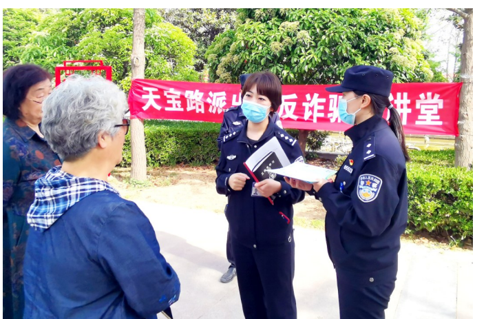
为进一步提高群众的识骗、防骗能力,连日来,许昌市公安局东城分局天宝路派出所坚持在辖区内人流量较大的场所开办反诈大讲堂。4月25日,该派出所民警在大讲堂上给群众讲解反诈知识。