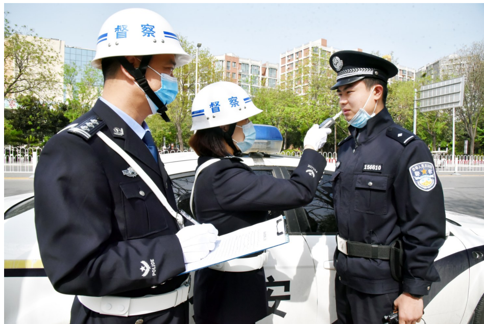
为把《公安部关于严禁违规宴请饮酒的规定》落到实处,提高民警规范执法能力,连日来,许昌市公安局魏都分局加大督察力度。图为4月22日,该分局督察部门民警对一线执勤民警进行酒精测试。