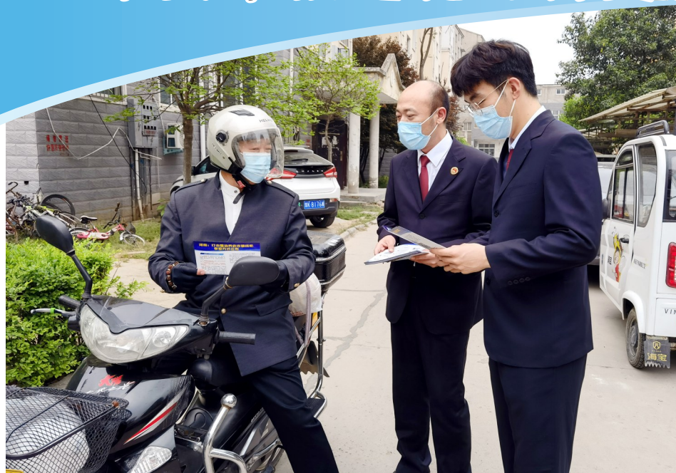
4月25日,鄢陵县人民检察院第一检察部干警走进鄢陵县城区三角广场和老年人居住较多的祥瑞小区,开展防范养老诈骗宣传活动,采取发放宣传彩页等措施,进一步提高老年人防范新型养老诈骗的能力。