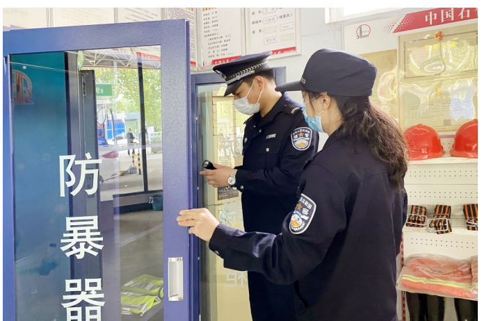
为消除安全隐患,连日来,许昌市公安局示范区分局尚集派出所围绕辖区内的加油站,开展安全大检查活动。图为4月24日,该派出所民警在加油站检查防暴设备配置使用情况。

经讯问,4名犯罪嫌疑人如实供述了2022年1月以来,多次窜至建安区分、襄城县和禹州市等地,盗窃炕烟烘干设备上铜管的犯罪事实,案值合计20余万元。目前,4名犯罪嫌疑人已被建安警方依法采取刑事强制措施,该案在进一步侦办中。