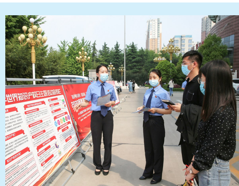
4月25日,在第22个世界知识产权日即将到来之际,禹州市人民检察院以“全面开启知识产权强国建设新征程”为主题,组织干警积极开展知识产权宣传活动。