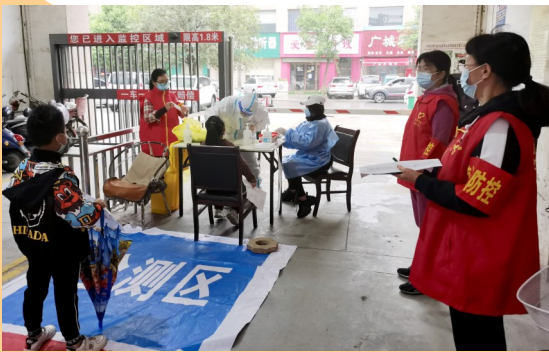
襄城县人民检察院干警在社区开展志愿服务活动

岁月带伤，亦有光芒；胸有丘壑，何惧秋凉。面对大考，“许检人”以“敢于亮剑”的使命担当，踔厉奋发、勇毅前行，树牢“赶考”思维，强化“答卷”意识，笃定“上榜”追求，全力以推动检察工作高质量发展和服务保障许昌经济社会高质量发展的出彩答卷，迎接党的二十大胜利召开。