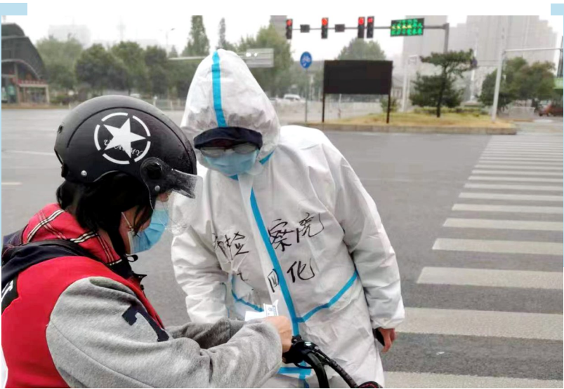
许昌市人民检察院干警在封控区卡点值勤值守