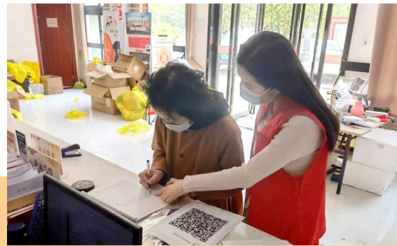
建安区人民检察院干警在社区指导居民填写抗疫有关信息