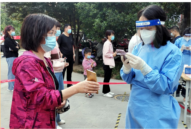
禹州市人民检察院干警进社区助力核酸检测