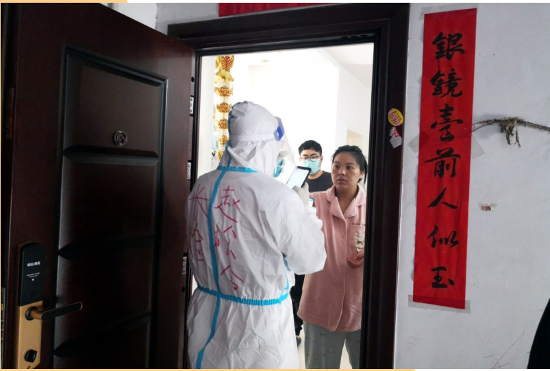
长葛市人民检察院干警上门为群众做核酸检测