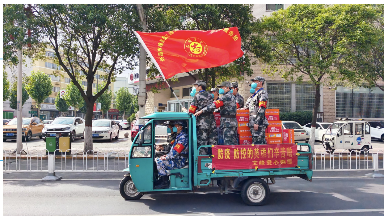
5月15日,许昌市文峰社区爱心粥屋的志愿者乘坐三轮车,往抗疫一线运送生活物资。疫情期间,许昌市文峰社区爱心粥屋组织人员,积极为抗疫一线工作人员提供午餐或生活物资。

5月9日当天,许继集团第一批返岗复工的988名工人到岗。5月14日,许继集团第二批返岗复工的1009名工人到岗。另外,52家本地配套企业186名员工驻厂复工。“自5月9日驻厂封闭生产以来,我们共完成产值1.84亿元,确保了湖北广水、南川工业园等重点工程的生产进度。”(下转第二版)