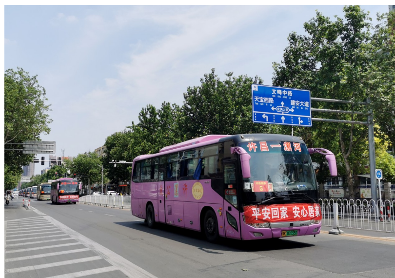
5月22日,在市区八一路,许昌高中300多名师生结束在漯河市方舱隔离点的集中隔离医学观察,统一乘车安全返回许昌。

本报讯(记者 许廷合)5月20日,记者从市文明办获悉,为深入贯彻落实习近平新时代中国特色社会主义思想,贯彻落实《新时代公民道德建设实施纲要》《新时代爱国主义教育实施纲要》,充分展示我市公民道德建设的丰硕成果,经市文明委研究,决定组织开展第六届许昌市道德模范暨2022年度“许昌好人”推荐、评选活动。该活动由市委宣传部、市文明办、市总工会、团市委、市妇联联合主办,由各主办单位联合成立评选活动组委会,并下设评选委员会,负责审议候选人资格及评选活动。