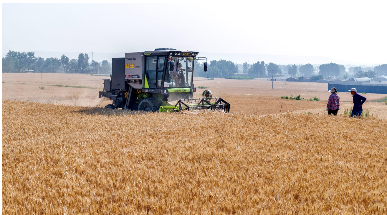
5月21日,襄城县湛北乡侯楼村开始收割小麦,拉开了襄城县“三夏”大忙的序幕。今年该乡共种植小麦2万多亩,比2021年增加4000余亩,预估今年每亩小麦比去年增产50多公斤。

防疫、保通要求。根据机械陆续到位情况,农机部门将合理分配机械,安排作业地点,指引转移路线,指导机手在遵守防疫要求、做好自身防护的前提下,全力抢收、顺畅转移;利用农业农村部门“农机直通车”系统、省气象服务中心应急短信平台、微信群等渠道,及时向机手发布机收动态、机械供求、天气预警等信息,引导机械有序流动;发挥“三夏”农机应急抢修服务队的作用,帮助机手及时排除故障,提升作业效率;结合小麦机收组织机收减损比武活动,以县为单位开展机收损失监测,努力把小麦机收平均损失率控制在2%以内。