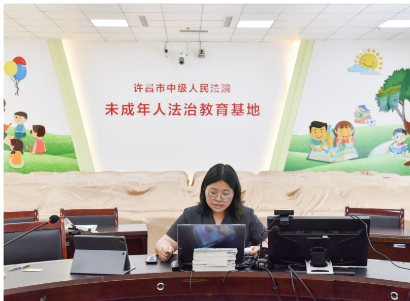
直播现场。

“上‘网络法治课’是我们积极应对疫情防控常态化推出的青少年法治教育新途径。今后,我们将坚持‘线上+线下’双线普法思路,充分发挥职能作用,帮助青少年养成学法、尊法、守法、用法的良好习惯。”许昌市中级人民法院未成年人综合审判庭负责人张靖介绍。