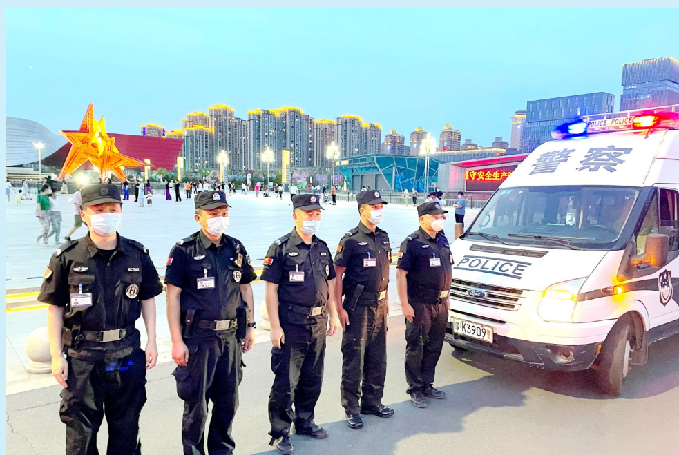
①入夏以来,根据警情特点,许昌市公安局东城分局加大辖区内重点区域的巡逻力度、频度。图为6月13日晚,该分局民警在市区科技广场附近值守。

在乡村,该县也将加强巡逻。按照部署,各镇专职巡逻队员在镇综治中心的统一指挥下,统一着装,对辖区进行日常巡逻,重点加大对集贸市场、镇区沿街商铺、饭店等人员集中区域、重点行业、重点部位和辖区各行政村的巡查力度。村级义务巡逻队、城区网格管理员和平安守护志愿者佩戴“平安守护志愿者”红袖标,在各自辖区内进行巡逻防范,提高群众见巡率,努力减少可防性案件的发生。