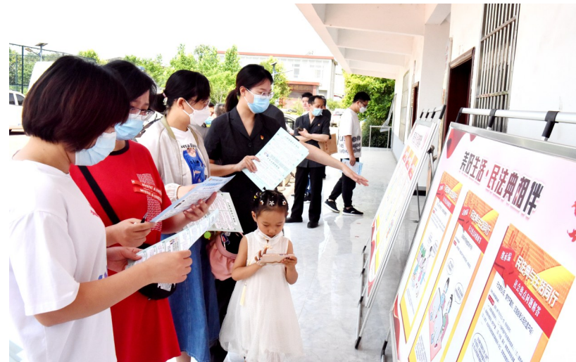
6月11日,许昌市中级人民法院组织部分支部党员干警到湖徐社区开展支部共建“手拉手”活动。图为干警在社区广场向社区群众现场讲解民法典、防范养老诈骗和电信诈骗等法律知识。

据悉,举办“新时代·高质量·更出彩”许检大讲堂,是许昌市人民检察院深入开展“能力作风建设年”活动的一项重要举措,其中,“新时代”是所在所处的历史方位,“高质量”是推动工作的主题主线,“更出彩”是争先创优的奋斗目标。大讲堂上,该检察院既邀请经验丰富的领导、专家上台讲授,又选拔业务一线摸爬滚打、久经实战的标兵、能手走上讲台,分享工作心得,碰撞思想火花。据悉,截至目前,许检大讲堂已举办5期。