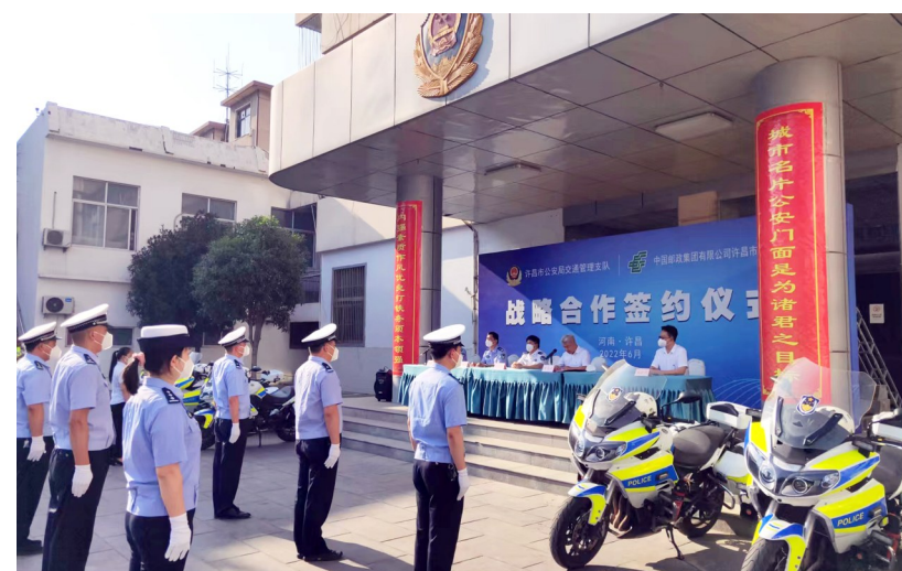
为深入推进公安交管“放管服”改革,6月15日上午,许昌市公安局交通管理支队与中国邮政集团有限公司许昌市分公司签订战略合作协议。双方将进一步创新警邮合作模式,为群众提供更为便捷的服务,努力实现“数据多跑腿,群众少跑路”。