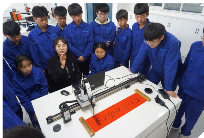
机电专业正在上课