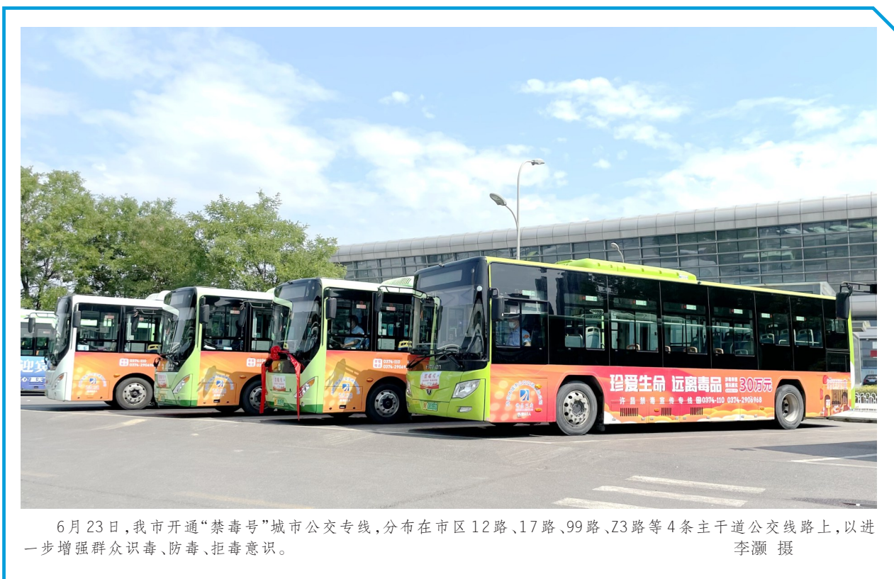
6月23日,我市开通“禁毒号”城市公交专线,分布在市区12路、17路、99路、Z3路等4条主干道公交线路,以进一步增强群众识毒、防毒、拒毒意识。