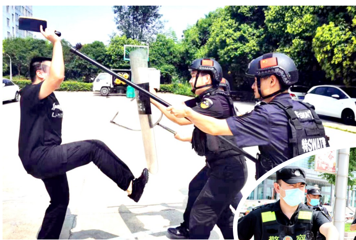
8月2日上午,禹州市公安局特警部门组织开展“防刀斧砍杀”实战演练活动。民警反应迅速、处置果断,迅速制服“持刀歹徒”,妥善处置个人极端暴力事件积累了经验。