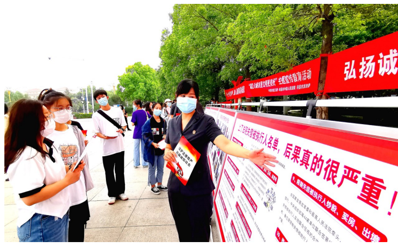
7月27日,许昌市中级人民法院联合市直工委、市发改委到许都公园共同开展诚信宣传活动。活动现场,法院干警通过悬挂条幅、摆放宣传展板、发放宣传页等方式,向过往群众讲解有关诚信方面的知识,介绍了许昌两级法院在失信惩戒、打击老赖等方面所做的工作,讲解失信曝光各项举措、维权渠道等。

民警把女孩儿带至南关派出所,并为其买来早餐,耐心地开导她,着重向其描述她父亲报警时的身体状态,特别是那双不停抖动的手。在民警劝说下,女孩儿决定向父亲道歉。就这样,父女俩重归于好。“我以后一定要注意教育孩子的方式方法,多与女儿沟通。”离开许昌时,殷先生向民警连连道谢。