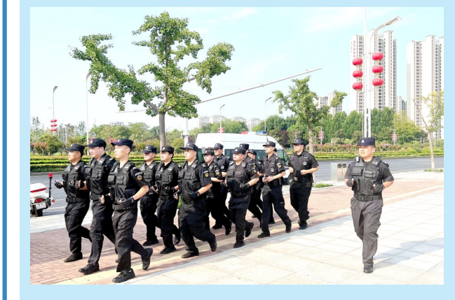
8月3日,许昌市公安局示范区分局开展岗位练兵活动,组织武装处突组、摩托车巡逻组、应急处置组等集结拉动,提升处置突发事件的能力。