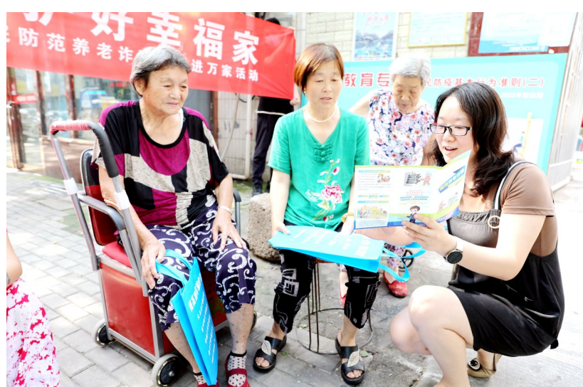
7月30日下午,许昌市人民检察院志愿者走进市区西大街街道办事处榆柳社区,开展老旧小区帮扶志愿服务暨防范养老诈骗宣传进万家活动。志愿者们向老年居民讲解防范养老诈骗相关知识,提醒老年居民遇到问题要第一时间告知子女并报警。