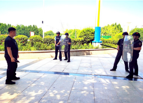
8月2日,襄城县公安局特警部门民警在襄城县市民广场开展应急处突实战演练活动,提高协作配合能力,增强克制制胜本领。