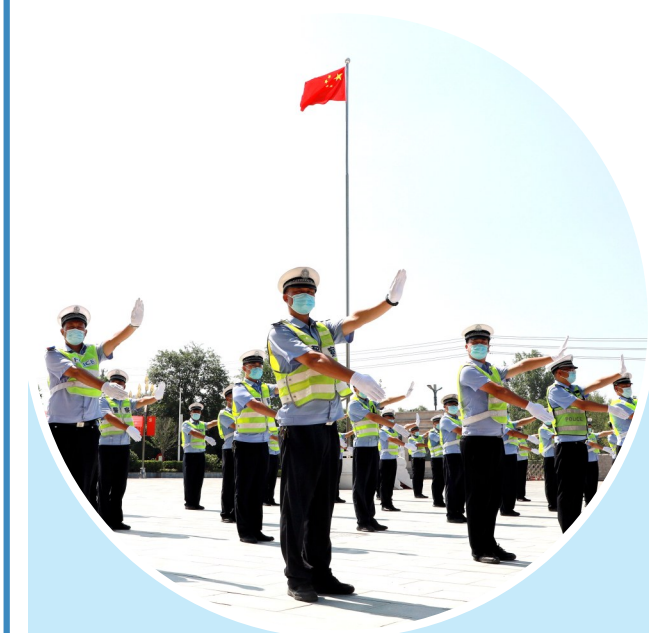
8月1日,鄢陵县公安局交通管理大队组织民警、辅警进行交通指挥手势训练,提高队伍的整体战斗力和凝聚力。