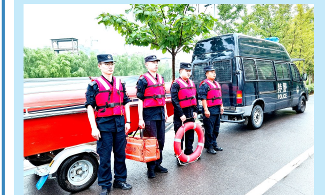
7月29日,长葛市公安局特警部门在长葛市区清漯河上开展防汛演练,提高水上救援能力。