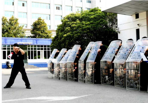
8月1日,许昌市公安局东城分局开展全警大练兵活动。烈日下,参训民警、辅警不怕苦,苦练盾牌使用基本战术,提高了协同作战能力。