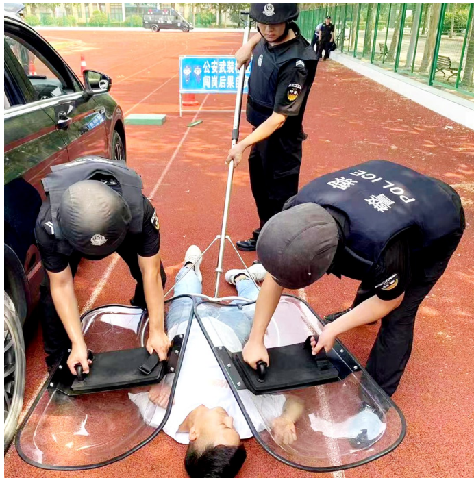
8月1日,在河南农业大学许昌校区操场上,许昌市建安区公安局特警部门开展反恐、防暴处突突发事件综合演练活动,提高应急处置能力。

夏日炎炎,酷暑当头,正是实战练兵的好时节。为提高综合素质、实战能力,锻造一支敢打硬仗、能打胜仗的公安队伍,连日来,我市公安机关特警、交警等警种部门以开展“能力作风建设年”活动为契机,突出实用、实效,坚持贴近一线、服务实战,持续开展练兵活动。在练兵场上,他们不惧高温的炙烤、汗水的洗礼,个个精神抖擞、口号响亮,人人步伐矫健、动作有力,展现了我市公安队伍的士气和风采,彰显了我市公安机关为民守平安的信心和决心。