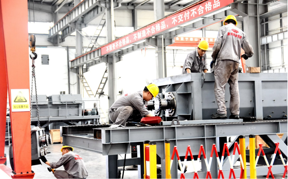
德通智能生产车间一派繁忙景象。

8月2日,魏都区召开全区领导干部会议,贯彻落实全市领导干部会议精神,总结今年上半年经济社会发展情况,深入分析当前形势,部署下半年全区经济社会发展工作。会议强调,全区上下要深入贯彻全市领导干部会议精神,深入开展“能力作风建设年”活动,立足本职,扎实工作,继续按照“三步并作两步走,一天当作两天用”的要求,砥砺奋进,大干5个月,奋力完成全年目标任务。