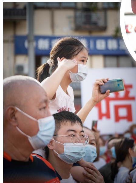
8月28日,在重庆市北碚区,群众自发来到道路两旁欢送森林消防队员。近日,重庆多地发生山火,在各方力量的共同救援下,目前重庆全部火场的明火已扑灭。8月28日,圆满完成此次山火扑救任务的300多名云南森林消防队员撤离重庆,众多重庆市民自发欢送。