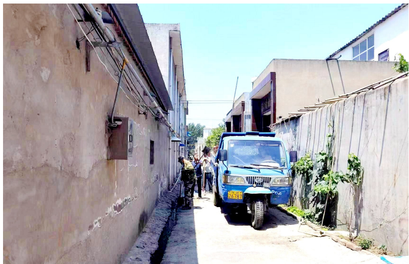
辛张社区对背街小巷垃圾进行集中清理。

辛张社区因地制宜实施“一宅变四园”工程,根据“空心宅院”的类型、大小、性质等,随形就势,宜改则改;对长期没有新建房屋意愿的“空心宅