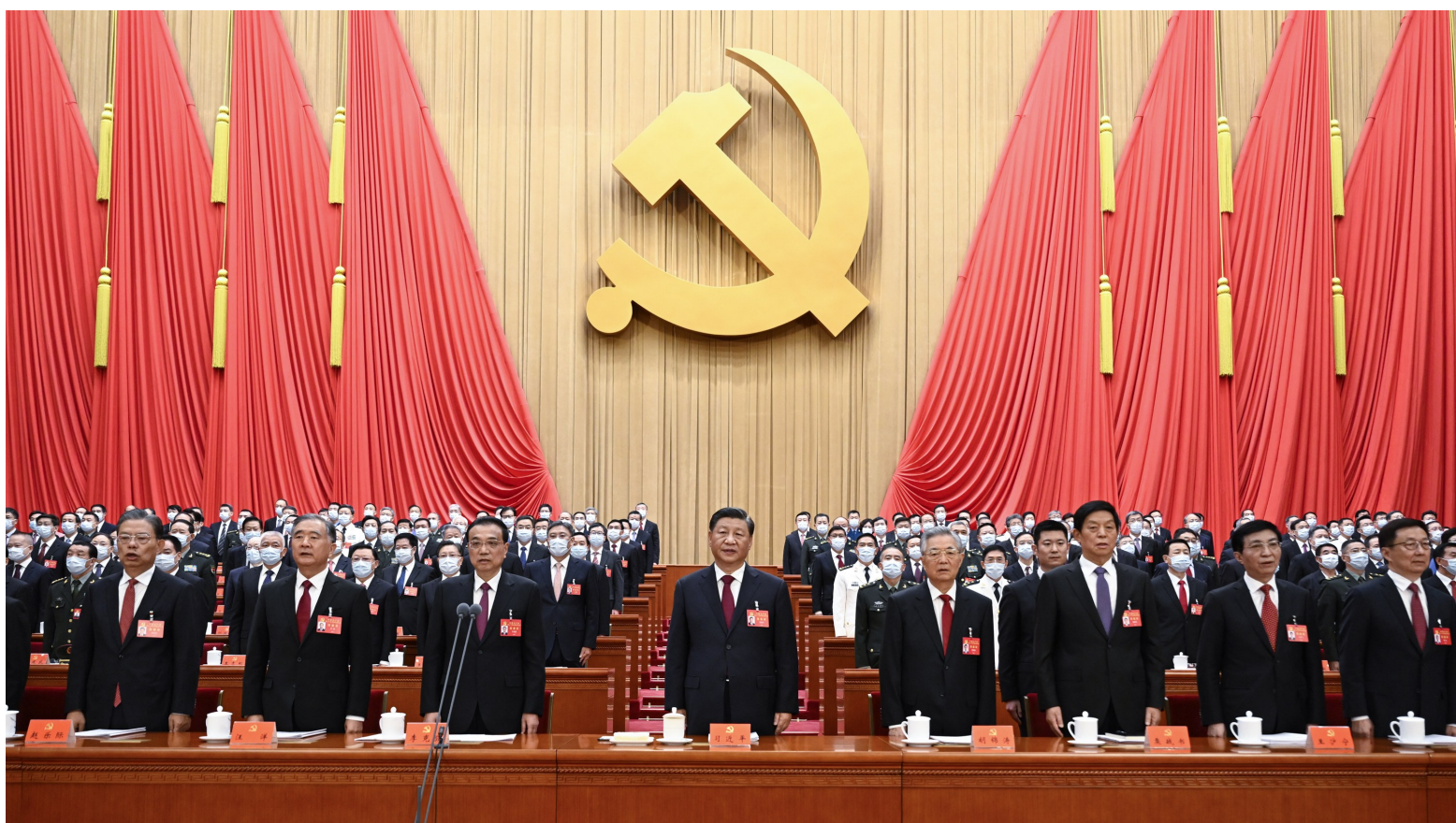
10月16日，中国共产党第二十次全国代表大会在北京人民大会堂开幕。这是习近平、李克强、栗战书、汪洋、王沪宁、赵乐际、韩正、胡锦涛在主席台上。

新华社北京10月16日电 凝心聚力擘画复兴新蓝图，团结奋进创造历史新伟业。举世瞩目的中国共产党第二十次全国代表大会16日上午在人民大会堂开幕。