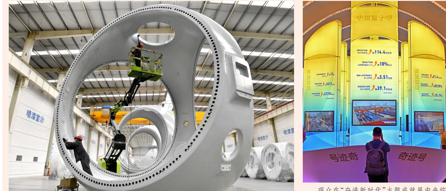
在山东省惠民县风电装备产业基地涂装车间，工作人员对风电轮毂进行涂装(2022年6月7日摄)。