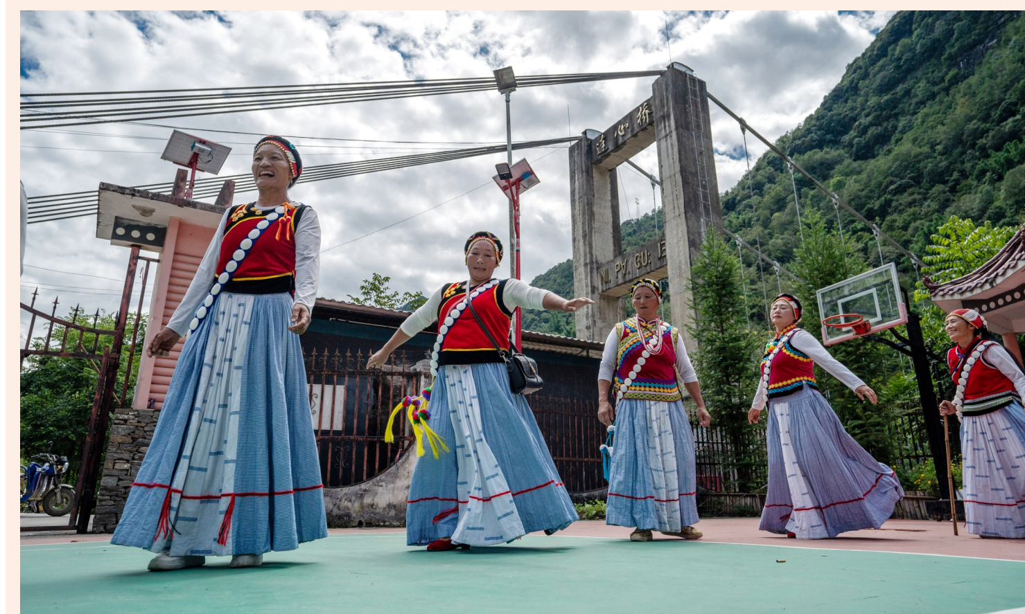
云南省怒江州福贡县石月亮乡拉玛底村村民自发组成的“奋进合唱团”在村委会排练节目(2022年9月14日摄)。2020年，怒江州26.96万贫困人口全部脱贫，249个贫困村全部出列，4个贫困县(市)全部摘帽。

确立和维护坚强的领导核心，创立和发展科学的指导思想，是马克思主义建党学说的重大原则，也是马克思主义唯物史观的根本要