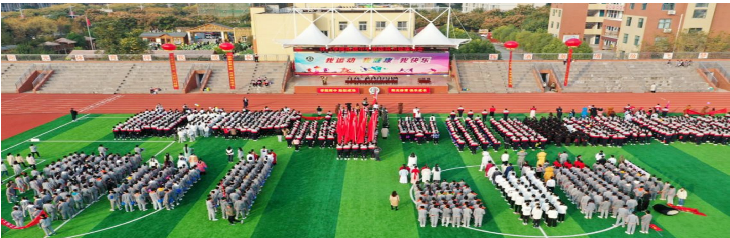
丰富多彩的文体活动让校园“活”起来、“动”起来

内外皆美方为美，人如是，学校亦如是。 学院附中着力抓好“四个校园”的建设，在多年如一日的辛勤编织下，一个林青水碧、钟灵毓秀、人文荟萃、温馨和谐的育人画卷得以呈现。 建设绿色校园。开展绿化工程、美化工程，让校园呈现出“春有花、夏有色、秋有果、冬有绿”的美丽景象；通过环保宣传展示、志愿服务等，让师生根植绿色理念，成为美的参与者、维护者。 建设文明校园。开展创“文明校园”“文明班级”系列活动，“文明守礼”“诚信孝善”德育活动和学雷锋志愿活动，使学生在潜移默化中得到熏陶。 建设书香校园。建设特色教室、文化长廊、校园图书馆“尚书房”，创办校刊《学苑》《教苑》；开展读书日、读书月系列活动，活跃校园文化。