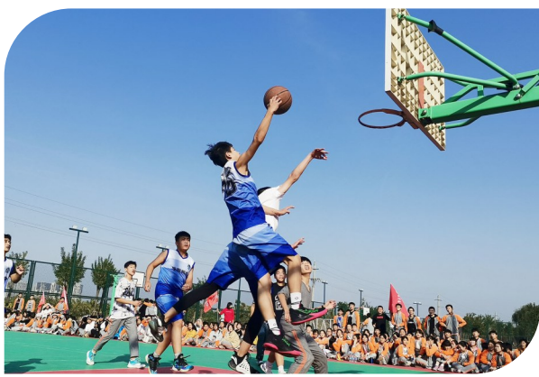
篮球社团联谊活动