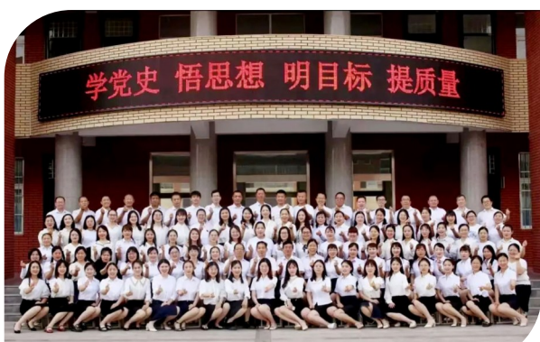
党史学习教育走深、走实、走心