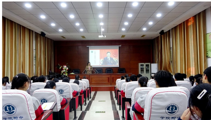
习近平总书记重要讲话精神专题宣讲