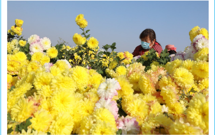
11月15日，焦作市温县祥云镇大尚村农民在采收菊花。初冬时节，“怀药”产地河南省焦作市温县的怀菊花陆续进入收获季，当地农民抓紧采收、加工、销售，供应市场。