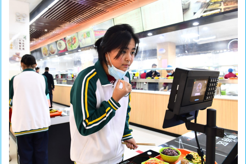
11月16日，在济南第三中学餐厅，学生通过智慧食堂就餐系统结算。山东省济南第三中学通过智慧食堂就餐系统，对食堂菜谱、菜品售卖情况、学生对菜品的喜爱度等进行大数据分析，实现了精准备餐，降低剩餐率。