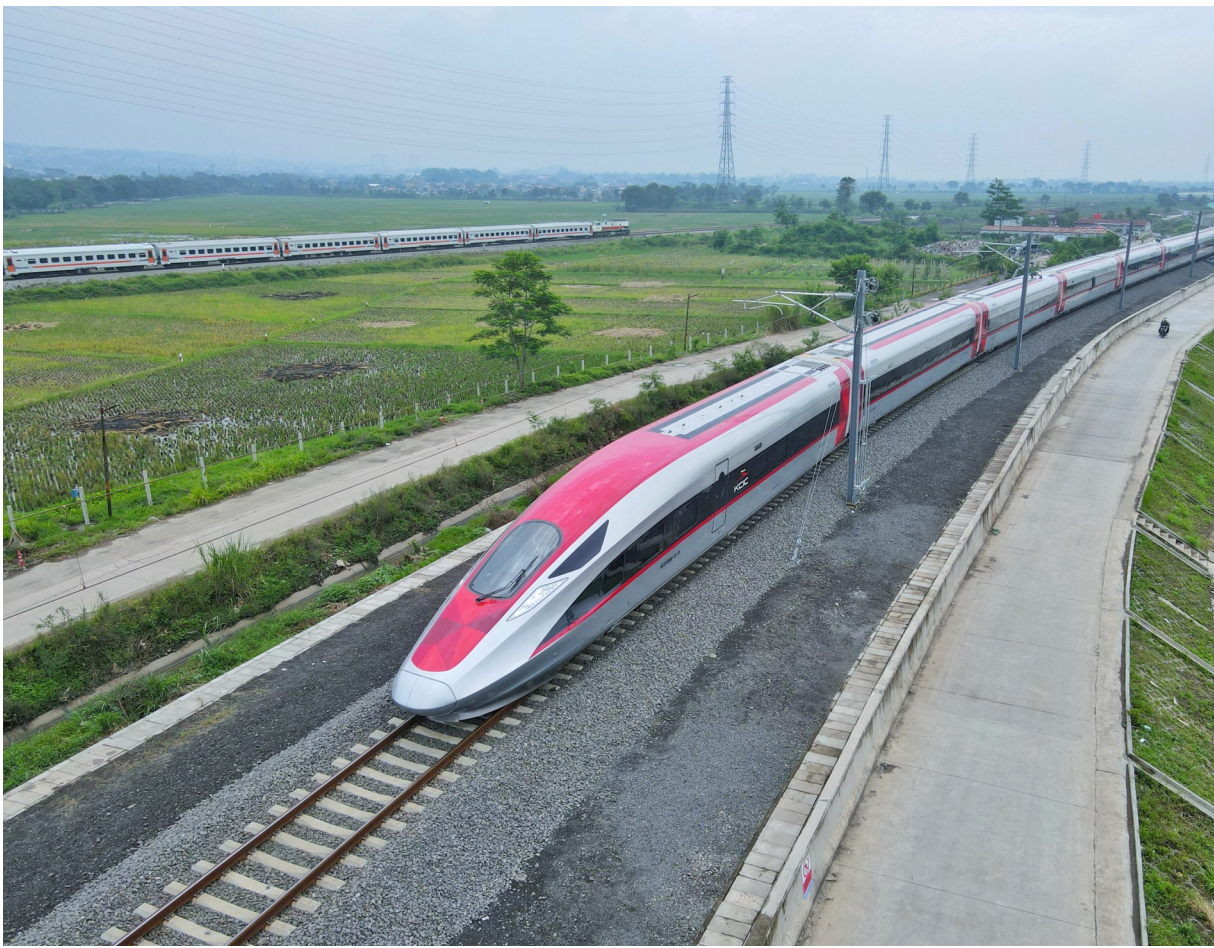
在印度尼西亚西爪哇省万隆市，一列高铁动车组正在雅万高铁试验段进行热滑试验(2022年11月9日摄，无人机照片)。

中国方案破解发展难题 发展为了什么？我们到底需要怎样的发展？ 当新冠肺炎疫情吞噬全球多年发展成果，联合国2030年可持续发展议