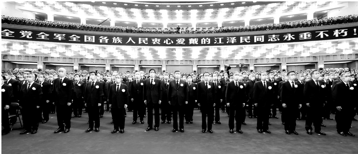
12月6日，中共中央、全国人大常委会、国务院、全国政协、中央军委在北京人民大会堂隆重举行江泽民同志追悼大会。习近平、李克强、栗战书、汪洋、李强、赵乐际、王沪宁、韩正、蔡奇、丁薛祥、李希、王岐山等参加大会。