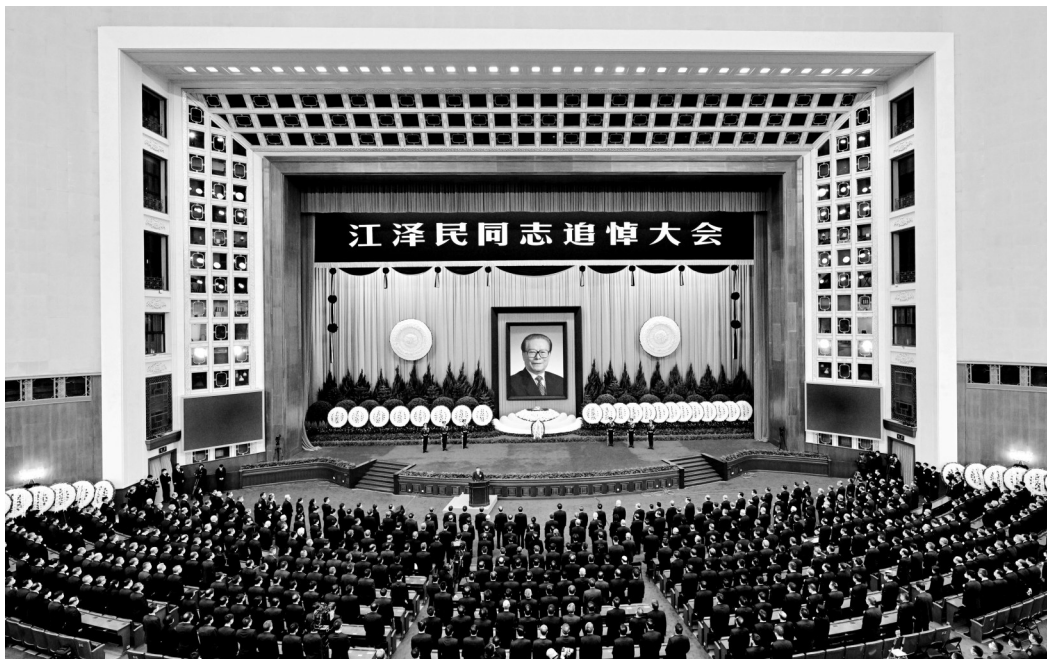
12月6日，中共中央、全国人大常委会、国务院、全国政协、中央军委在北京人民大会堂隆重举行江泽民同志追悼大会。