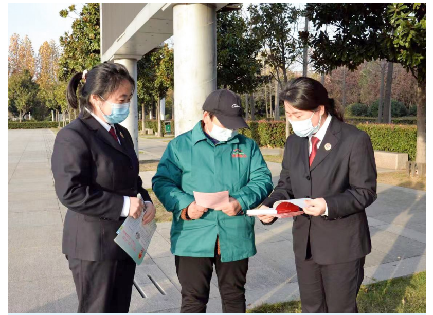
12月2日,建安区人民法院组织干警在北海广场开展法治宣传活动。干警采取发放宣传材料、提供法律咨询等方式,向过往群众讲解与群众生活关系密切的法治知识,引导群众学法、懂法、守法、用法。

制定发布许昌市行政相对人法律风险点防控清单。创新宣传方式方法,不断增强行政相对人违法风险防范意识,实现执法效果和社会效果的有机统一。