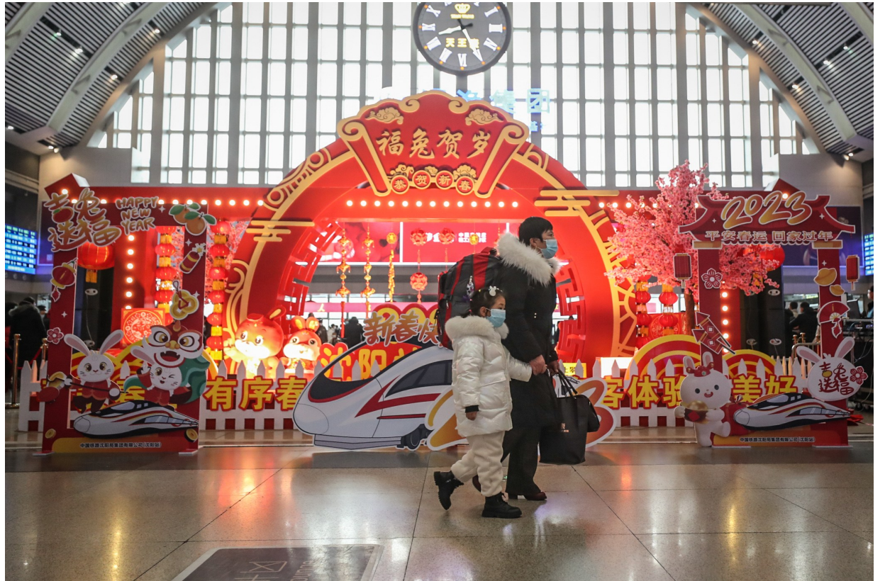
1月7日,旅客在沈阳站候车大厅准备乘车。当日,2023年春运启动。2023年春运从1月7日开始,至2月15日结束,共40天。

部门负责人表示,春运期间,铁路部门将认真落实好疫情防控和安全管理各项措施,同时统筹用好2022年开通的新线、新站资源,以及新投用的复兴号动车组等先进装备,增强路网整体功能,提升客运能力。