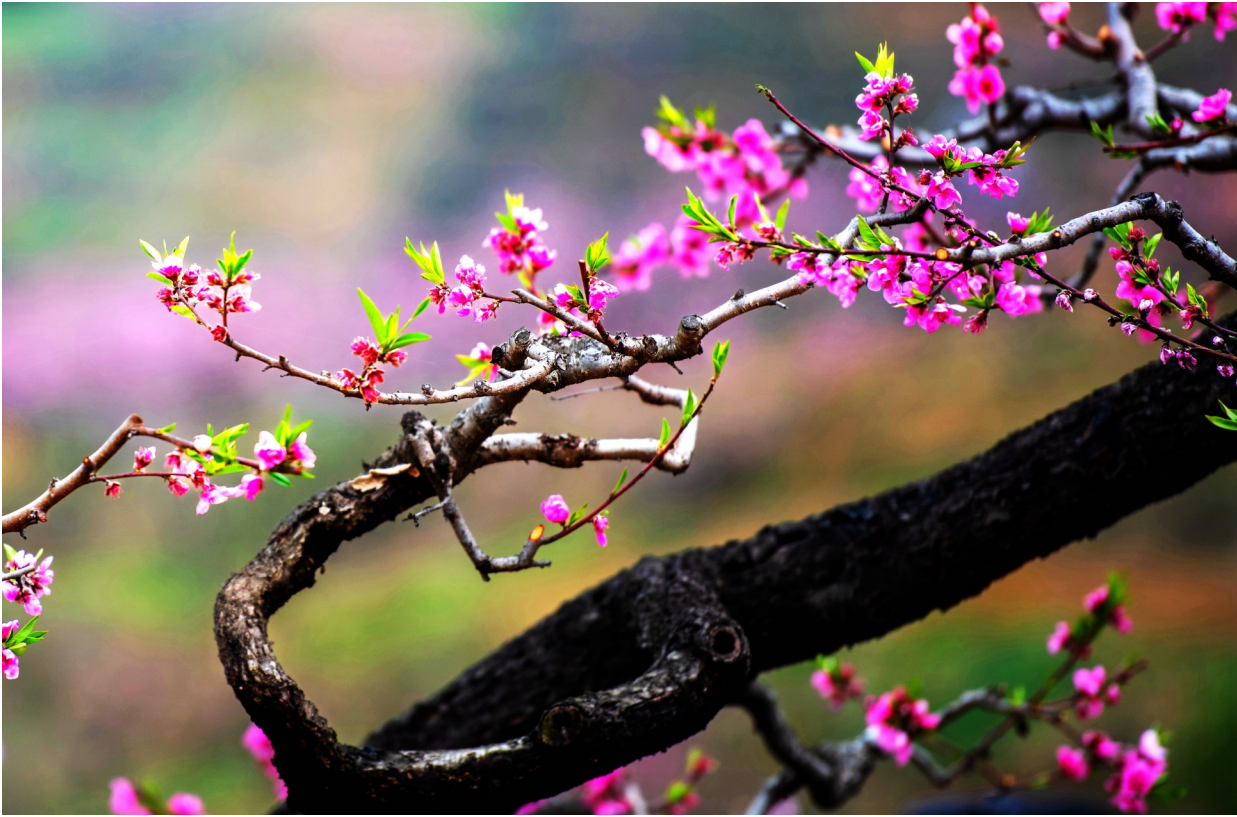
桃花弄春脸

走过荆棘沼泽，从嘉兴南湖的小小红船一路出发，披荆斩棘的战士们用热血踏出一条信仰与光明之路，穿越百年与我相会。团结奋斗的青年人，就用你那傲然的姿态去引领出属于我们的未来吧，将一部又一部壮丽的史诗继续镌刻在世界的舞台上，迎着那光芒万丈的五星星，所向披靡。