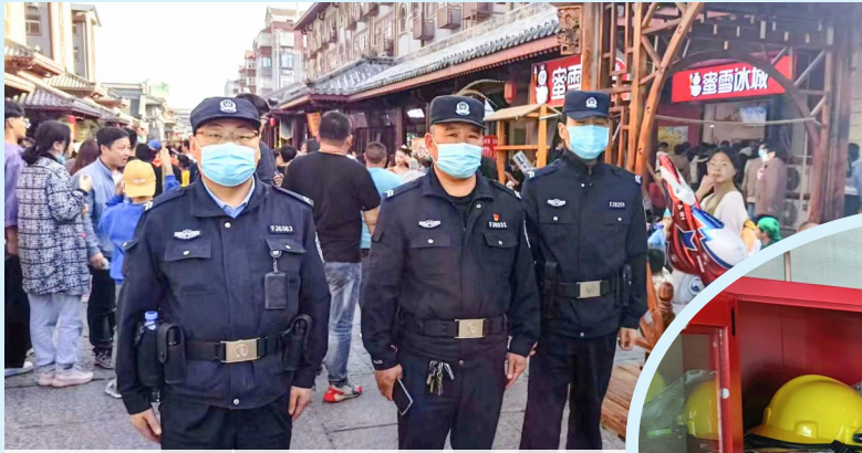
5月1日,许昌市公安局魏都分局民警在曹魏古城内值守,保证来许游客平安开心游玩。