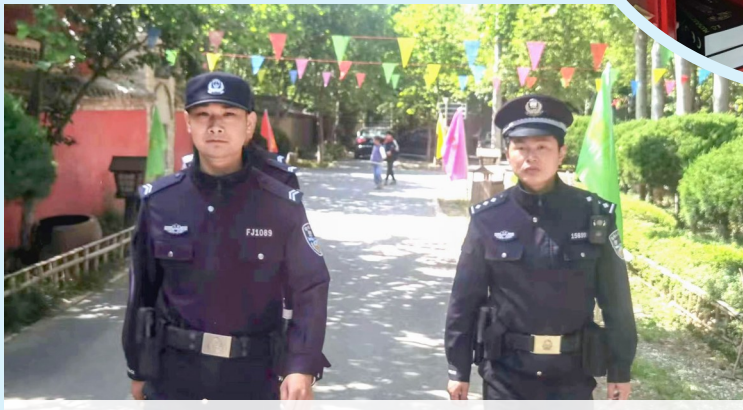
5月1日,鄢陵县公安局陈化店派出所民警在辖区内景点周边巡逻,提高街面见警率。