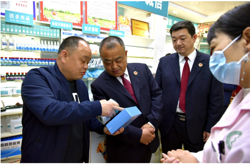
日前,鄢陵县人民检察院干警同鄢陵县市场监督管理局工作人员一起,到城区部分药店走访检查,开展保健食品安全监督检查工作,保障人民群众食品药品安全。