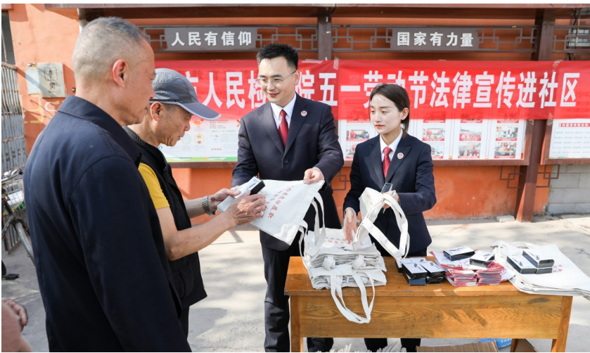
4月27日,许昌市人民检察院联合魏都区北大街道办事处西湖社区开展五一劳动节法律宣传进社区活动,引导社区群众运用正确的法律手段解决工作中遇到的难题,打造办事依法、遇事找法、解决问题用法、化解矛盾靠法的良好环境。