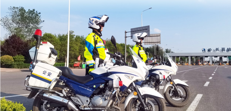
5月1日,长葛市公安局交通管理大队民警在高速公路上下站口值守,为假期道路畅通有序、群众出行平安提供保障。

“五一”小长假里,来许游客大大增加。结合实际,我市公安机关科学布警,最大限度把警力摆在群众看得见的地方,强化在重点区域、路段的巡逻值守,切实提高街面见警率、管事率。广大民警、辅警扎实做好社会面管控、安全监管、交通秩序维护等重点工作,保证了假期全市社会大局的持续稳定。