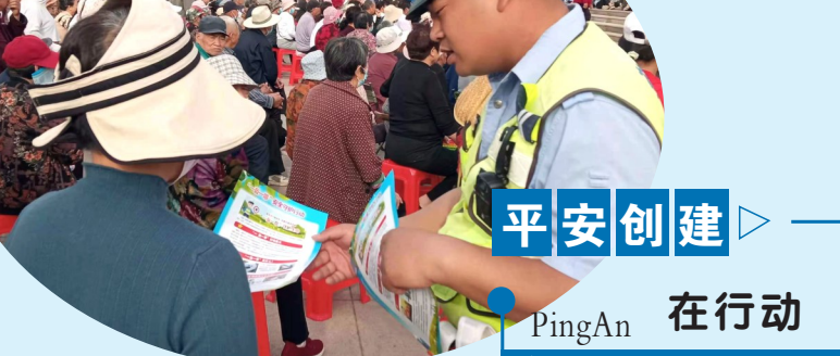
5月1日,许昌市建安区公安局交通管理大队民警在北海广场宣传交通安全知识,提醒群众自觉佩戴头盔、使用安全带。