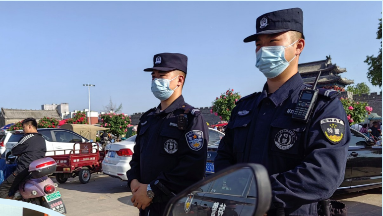
4月30日,襄城县公安局民警在辖区内景点附近值守,为民守护平安。