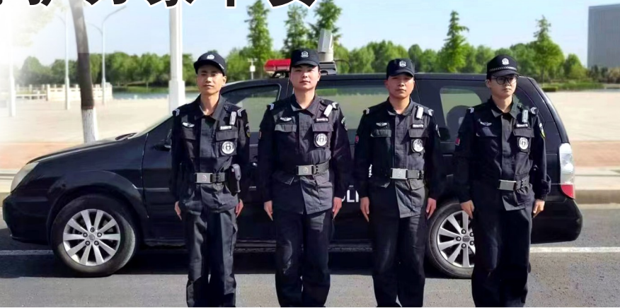
假期里,许昌市公安局示范区分局把警力摆在街面上,随时为需要帮助的群众提供服务。图为5月1日该分局民警在路面上值守。