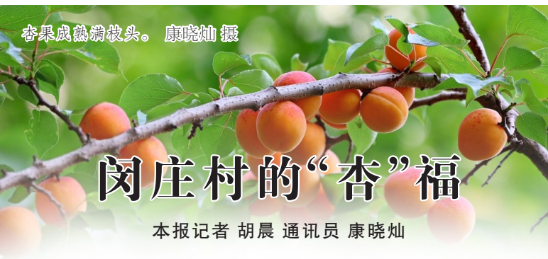
杏果压弯枝头。