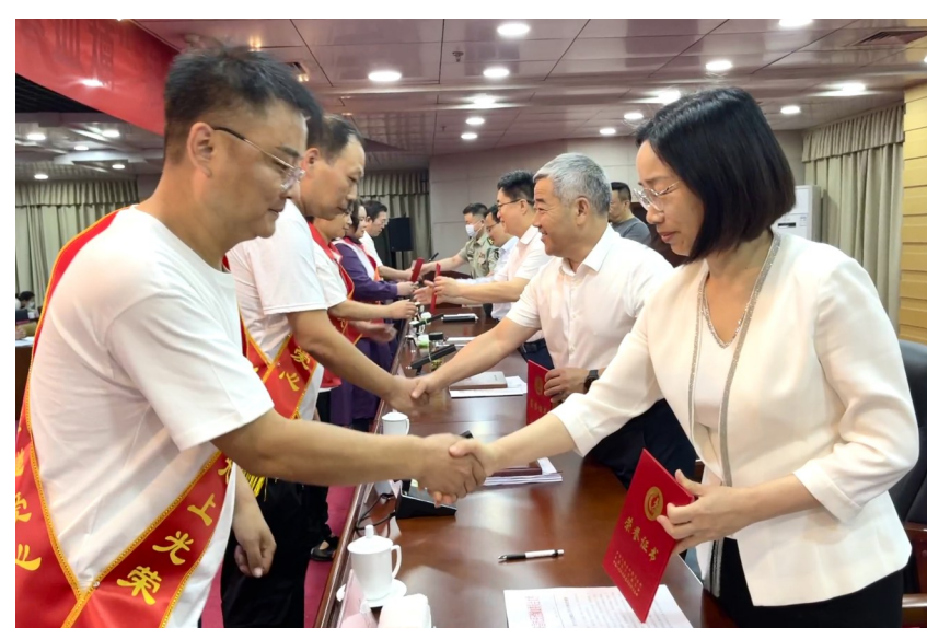
为获表扬者代表颁奖