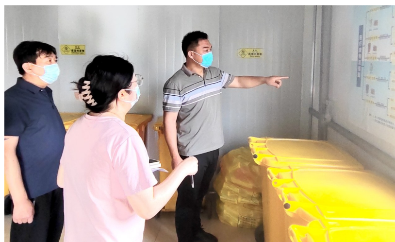
检查医疗废物暂存、处置情况。资料图片