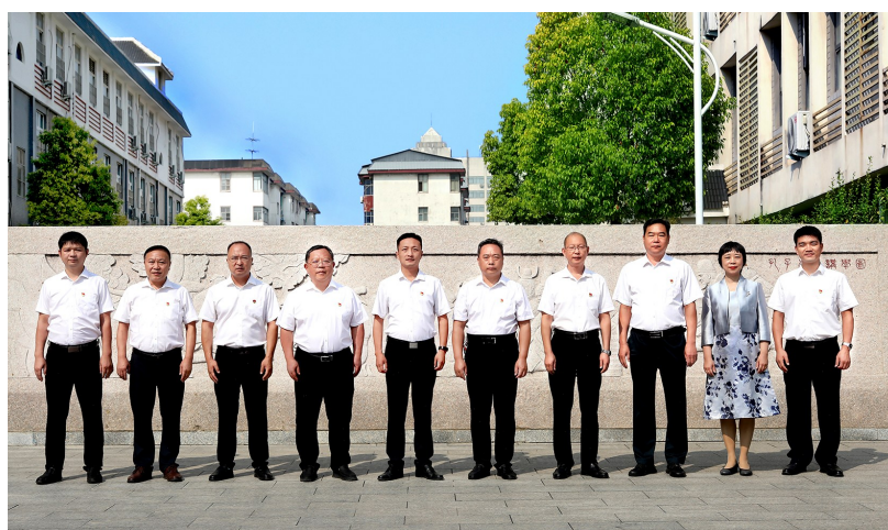
团结奋进的领导班子