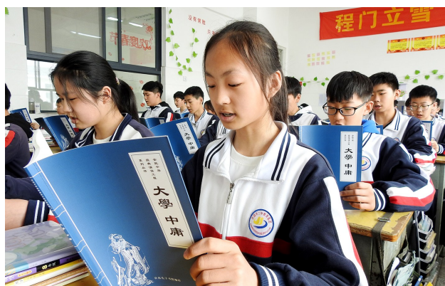
开展经典诵读活动