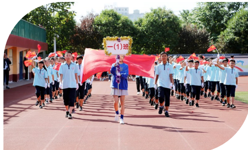
学校运动会开幕式