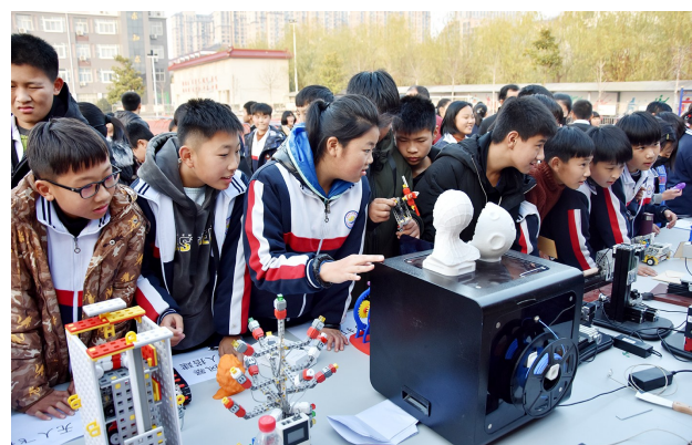
丰富多彩的校园科技节