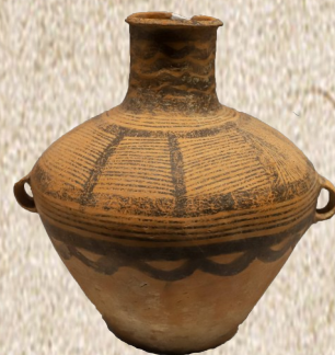
二里头遗址出土的陶器