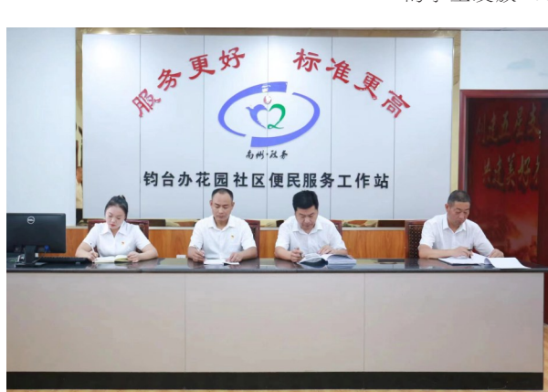
花园社区便民服务工作站