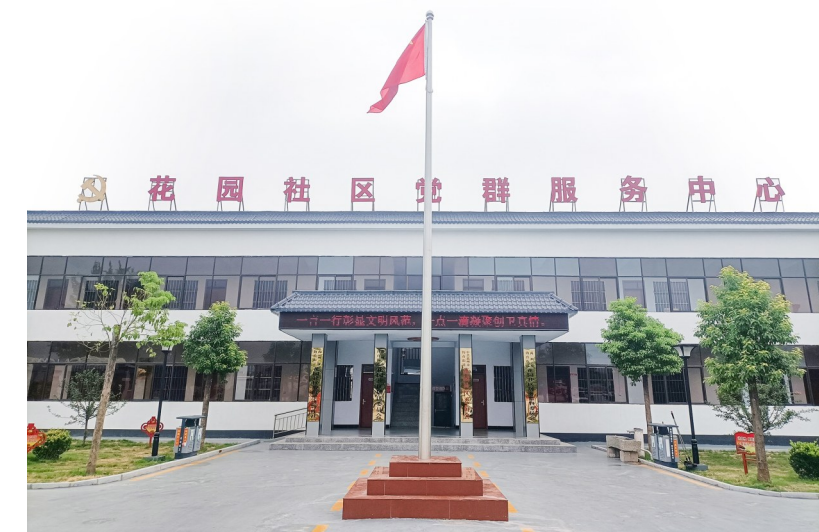
钧台街道办事处花园社区办公楼

在社区办公楼最前面，有两块红色的大牌子，上面清晰地显示着5个创建专班组长、组员的姓名和照片。用该社