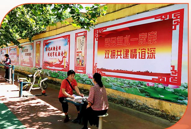
双拥标语随处可见,双拥氛围浓厚