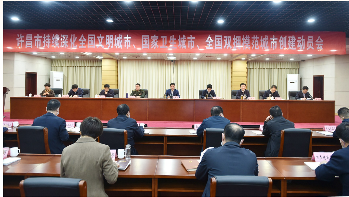
2023年3月7日市委、市政府组织召开全国双拥模范城市创建动员会

时代变迁,变不了拳拳拥军爱民之心;岁月更迭,掩不住浓浓鱼水深情。近年来,我市深入贯彻落实习近平总书记关于新时代双拥工作的重要论述,坚持把双拥工作作为一项政治性、全局性、战略性工作任务,继承和发扬双拥优良传统,加强军地双方相互融合、相互协调、良性互动,在全市各级党政机关、驻许部队和广大人民群众共同努力下,形成了“一盘棋统筹、一张网覆盖、一体化发展”的新时代双拥工作大格局,有力支撑和保障了我市经济社会发展和社会和谐稳定。