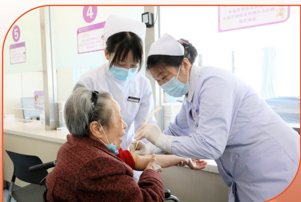
为一等功臣免费体检