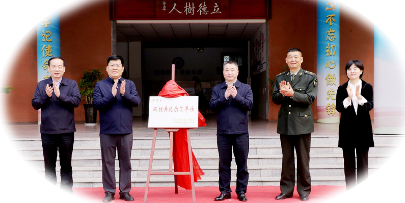
2023年4月18日,我市举行“河南省双拥共建示范单位”授牌仪式

2020年以来,连年超额完成征兵任务,为975名立功受奖许昌籍军人家庭送喜报,发放奖励金203万元,对958名许昌籍驻守边防官兵和137名许昌籍执行专项任务官兵的家庭进行慰问,帮助困难官兵100余