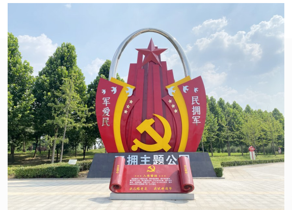
禹州市双拥主题公园

鱼水情深,历久弥新。我市正以勇往直前的奋斗姿态,持续发扬“全国双拥模范城”优良传统,推动新时代双拥工作迈上新台阶,为我市城乡融合共同富裕先行试验区建设凝聚强大力量。