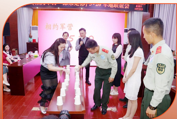
魏都区妇联、武警许昌支队举行军地青年联谊会

习近平总书记指出,新形势下,双拥工作只能加强、不能削弱。多年来,许昌市委、市政府高度重视双拥工作,始终坚持把双拥工作作为“一把手”工程,纳入全市经济社会发展总体规划,写入《政府工作报告》,摆上重要议事日程,与全市经济社会发展同部署、同落实、同检查。