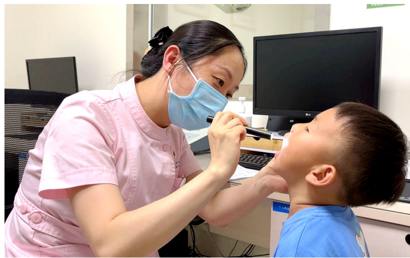
入园体检 资料图片