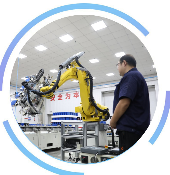
魏都区储能产业园项目