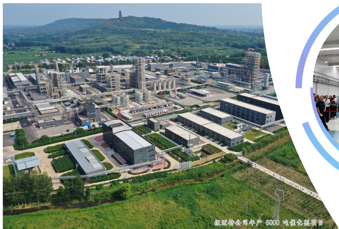
纽瑞特公司年产6000吨催化剂项目