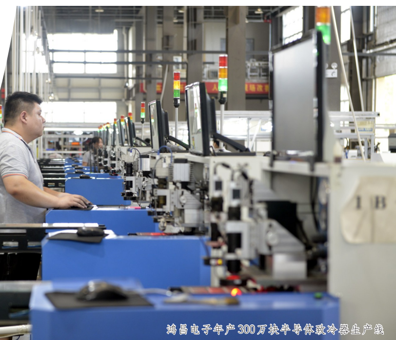
鸿昌电子年产300万块半导体散热器生产线