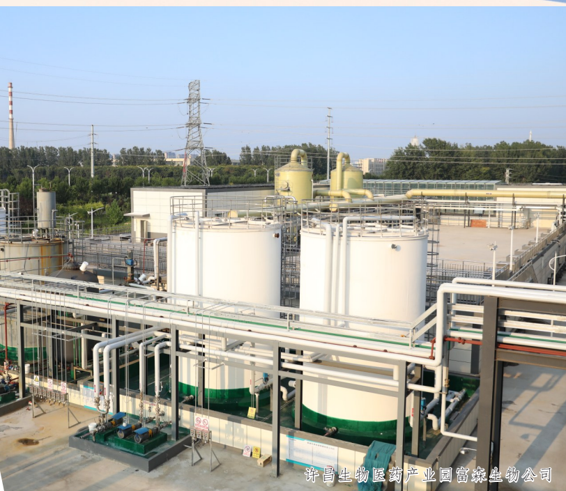
许昌生物医药产业园富康生物公司