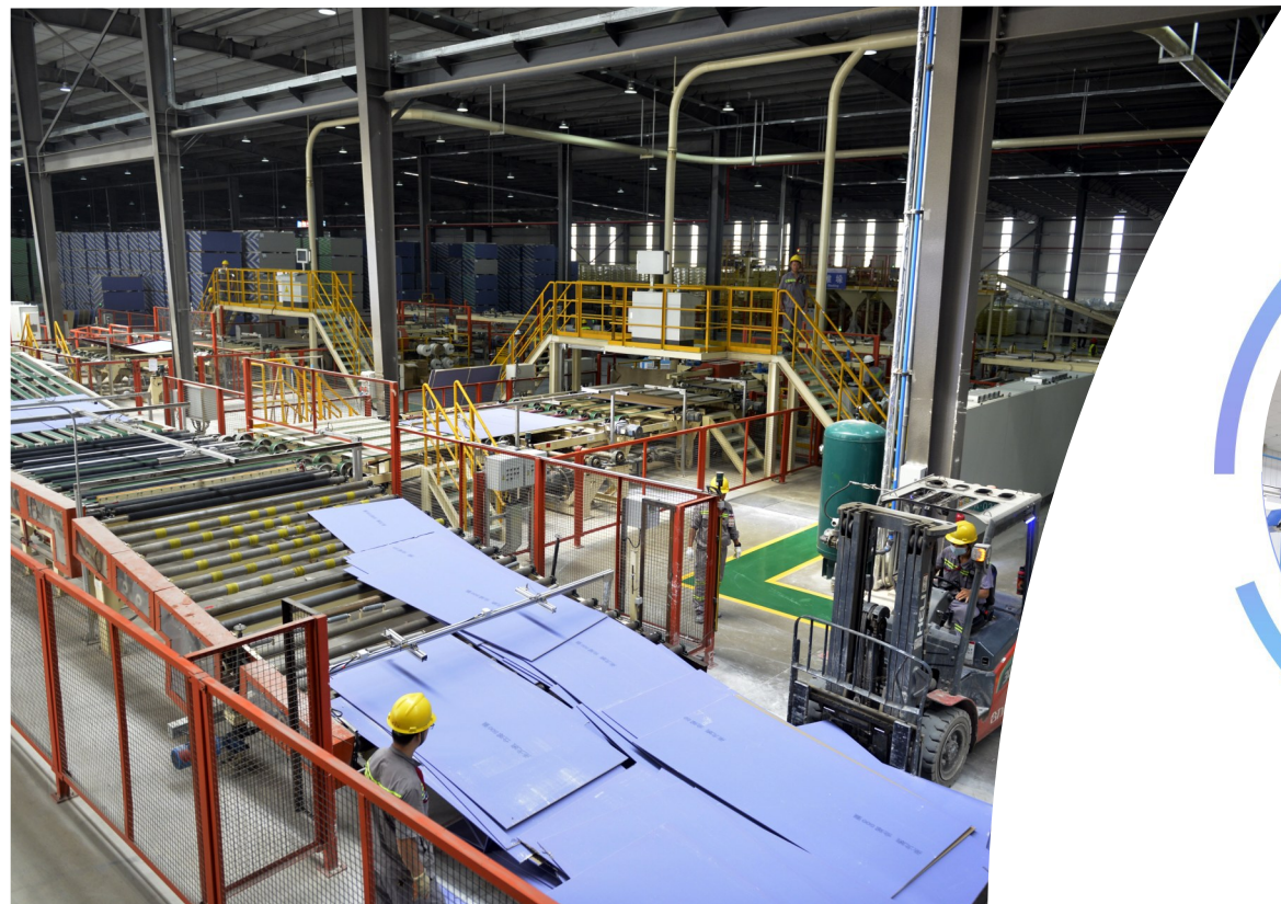
法国圣戈班禹州高性能科技材料项目