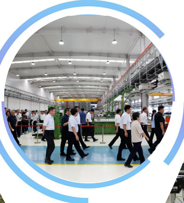
观摩团成员在许昌烟机新产品研发试制生产项目观摩。