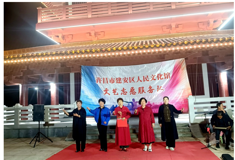
演出现场 资料图片

本报讯(通讯员 张倩)每当夜幕降临,建安阁北海公园的建安阁华灯绽放,犹如一颗闪亮的明珠照亮北海的夜。三三两两的群众提着板凳、掂着马扎,朝着共同的目的地——建安阁赶去。晚上7时左右,音乐声起,建安阁人民文化馆志愿服务队的志愿者们轮流上场,戏曲、歌舞、社火等节目精彩纷呈。