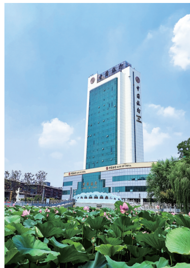
中国银行 全球服务