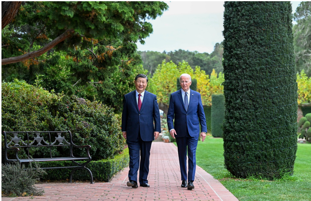
当地时间11月15日,国家主席习近平在美国旧金山斐洛里庄园同美国总统拜登举行中美元首会晤。这是会谈后,拜登邀请习近平一道在斐洛里庄园里散步。