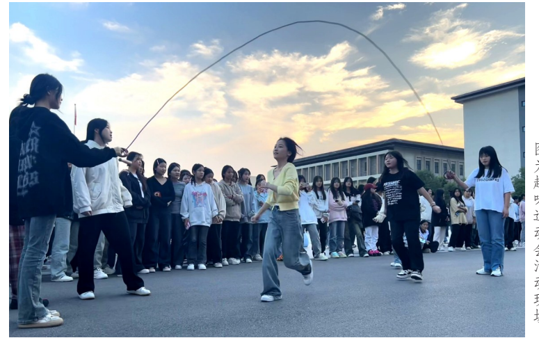
图为趣味运动会活动现场。

本报讯(记者吕正子 通讯员王欣文/图)为给青少年种下爱运动的种子,营造奋发有为、团结拼搏的校园文化氛围,近日,许昌幼儿师范学校举行2023年学生趣味运动会。