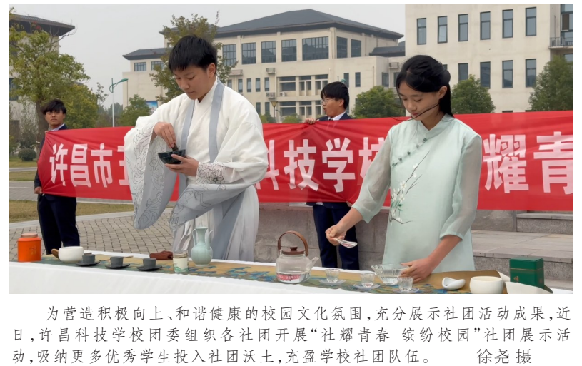
为营造积极向上、和谐健康的校园文化氛围,充分展示社团活动成果,近日,许昌科技学校团委组织各社团开展“社耀青春 缤纷校园”社团展示活动,吸纳更多优秀学生投入社团沃土,充盈学校社团队伍。