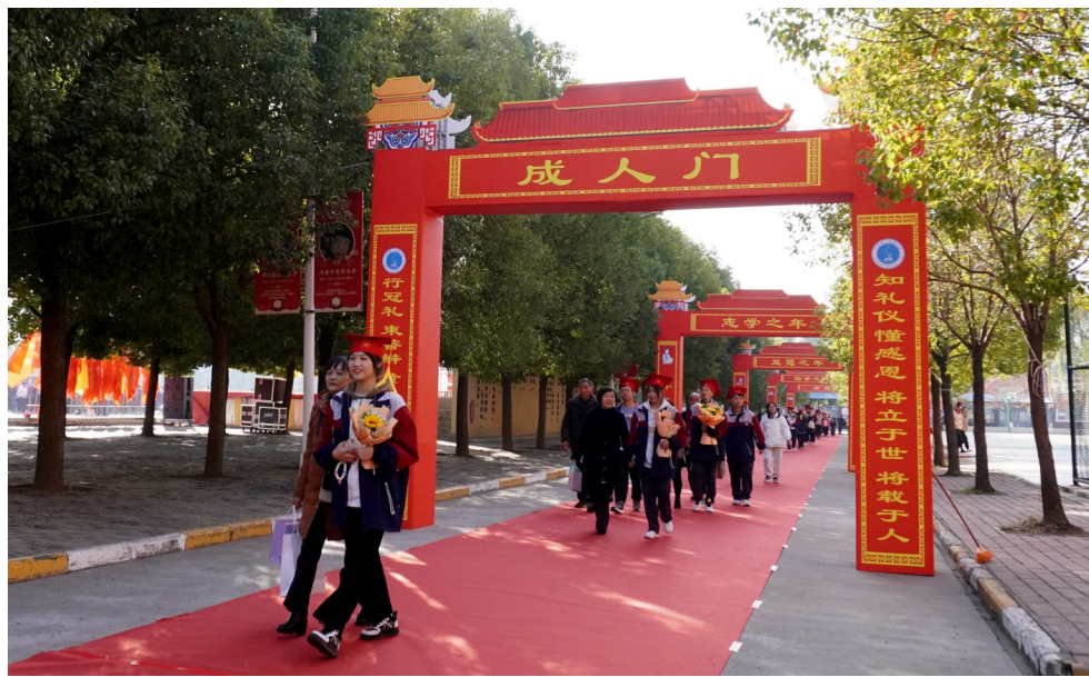
11月18日,许昌二高举办2024届高三学子18岁成人礼。图为学生们在家长陪同下走过成人门。

该校有关负责人表示,让书香浸润心灵,让书香相伴成长,是该校打造“书香校园”的宗旨。本次读书让学生在阅读分享中收获了读书的快乐,也领悟了经典的价值。