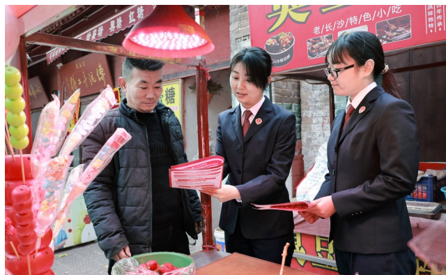
▲ 12月4日是第十个国家宪法日。为深入学习宣传贯彻党的二十大精神,弘扬宪法精神、维护宪法权威,12月1日,襄城县人民检察院干警走进市场,开展国家宪法日宣传活动,增强群众的法治意识。

想特别是习近平法治思想、习近平文化思想,宪法,社会主义法治文化,党的十八大以来全面依法治国取得的成就等内容。活动期间,我市将举办“12·4”宪法宣传周启动仪式,相关部门结合实际开展宪法进企业、进机关、进校园、进农村、进社区、进军营等主题活动,开展特色鲜明、形式多样、内容丰富的线上宣传活动,广泛开展形式多样的群众性法治文化活动,组织收听收看2023年度法治人物特别节目等一系列主题活动,切实推动宪法学习宣传走深走实,取得实效。