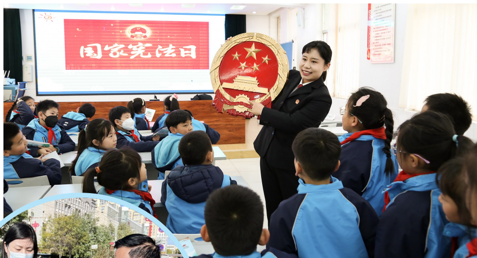
▲ 11月30日,在第十个国家宪法日来临之际,魏都区人民法院组织法官来到辖区小学开展“国家宪法日普法进校园”活动,带领同学们学习宪法、了解宪法,增强法治观念,培养爱国情怀,自觉信仰宪法、尊崇宪法。