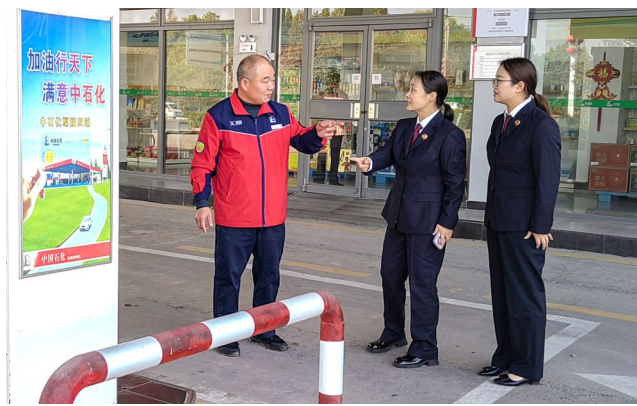
开展专项检查,督促落实安全生产举措

动5场,发放资料3000余份。国以安为宁、业以安为兴、民以安为乐。鄢陵县人民检察院党组书记、检察长郭亚峰表示:“鄢陵县人民检察院将继续秉承司法为民理念,依法能动履职,办好民生实事,以更实举措落实‘八号检察建议’,保障社会公共安全和人民群众生命财产安全,以检察担当助力‘平安鄢陵’建设再上新台阶。”