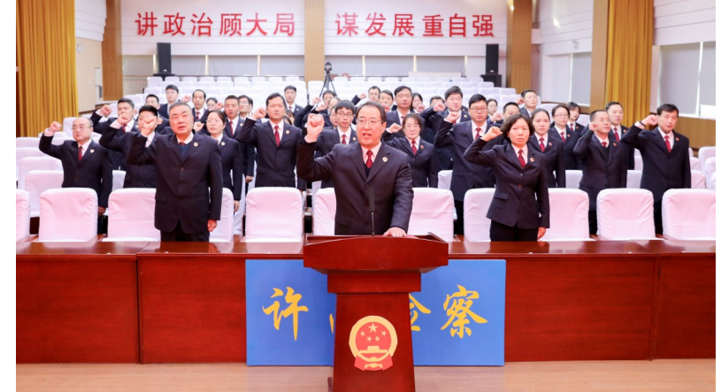
12月4日,许昌市人民检察院举行宪法宣誓仪式。2023年新提拔领导干部、新晋职晋级人员、新入额检察官和新进干警右手宣誓,面向国旗庄严宣誓。王凯 摄

2023年“宪法宣传周”活动启动以来,襄城县人大常委会紧紧围绕“大力弘扬宪法精神 建设社会主义法治文化”主题,积极开展宪法宣讲及宪法进农村、进社区、进校园、进机关、进企业、进网络等活动。同时,他们依托各