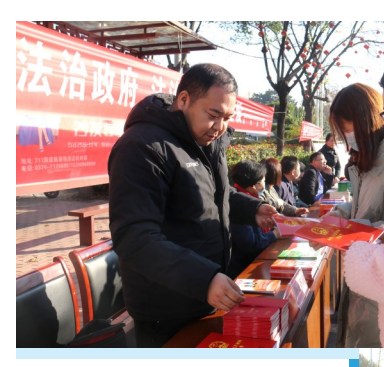
12月4日,鄢陵县直48家法治成员单位开展“宪法宣传周”集中宣传活动,展出宣传展板120块,发放宣传资料5600余份,大力弘扬宪法精神。