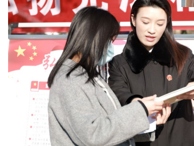
12月4日,鄢陵县人民法院法官开展宪法宣传活动,营造尊法、学法、守法、用法的浓厚社会氛围。