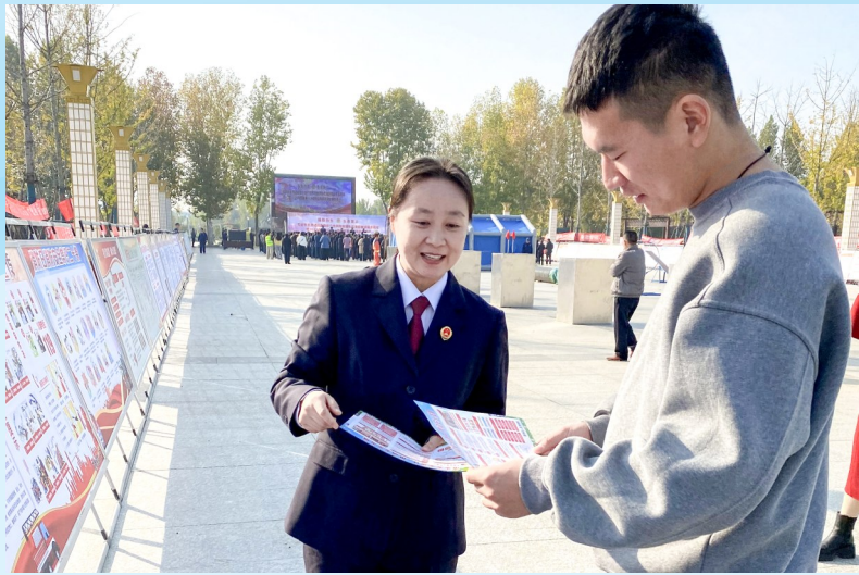
开展宣传活动,增强群众安全生产意识

安全生产事关人民福祉,事关经济社会发展大局。在鄢陵,满满的安全感中,有一缕“检察蓝”萦绕其间。