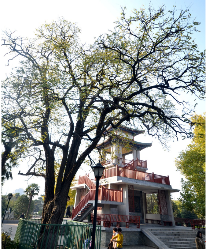
市民在西湖公园德星亭旁的刺槐下游玩