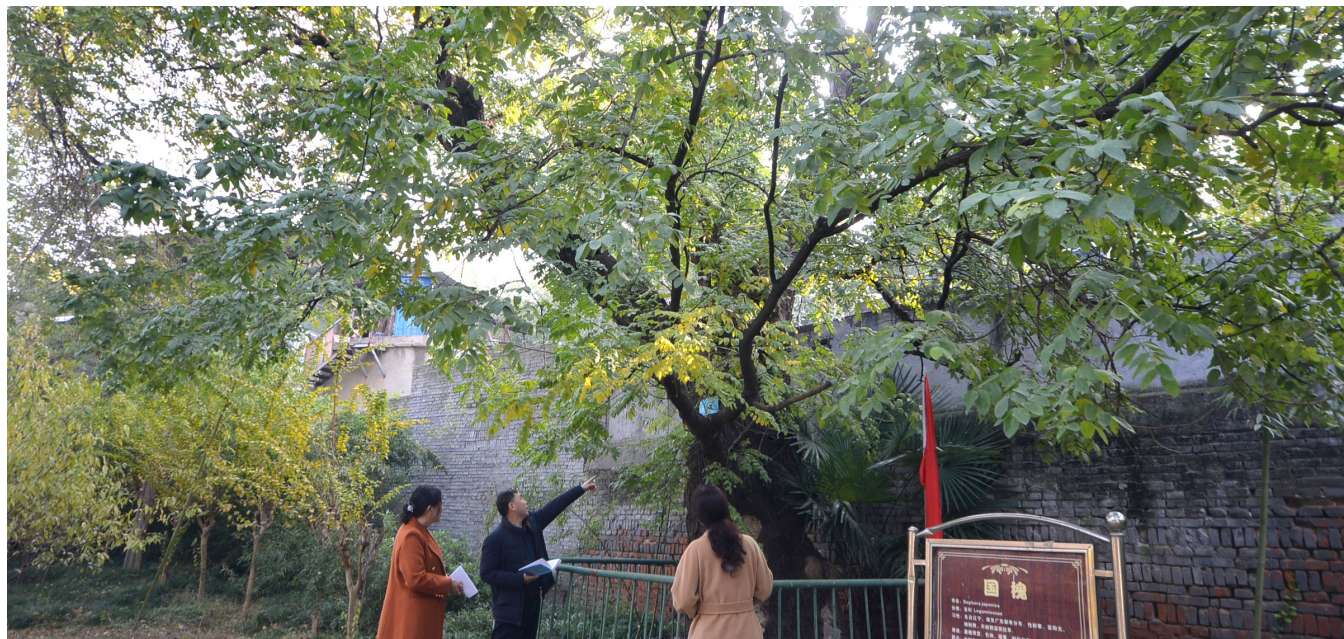
我市林业、园林及西湖公园管理部门对古树进行调查

古树名木的年里,记录着人文故事,也寄托着人们无尽的乡愁。近年来,我市把古树名木保护作为生态文明建设的重要内容,实行全面保护、依法保护、科学管护,注重与传承历史文化紧密结合,让古树名木持续焕发勃勃生机,演绎出一个个人与自然和谐共生的精彩故事。