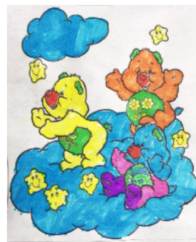
市南关村小学 二(10)班 刘杨子奇