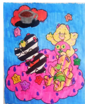
襄城县城关镇 南大街回民中心小学 五(3)班 王艺