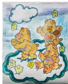
市学府街小学 二(5)班 王琳涵