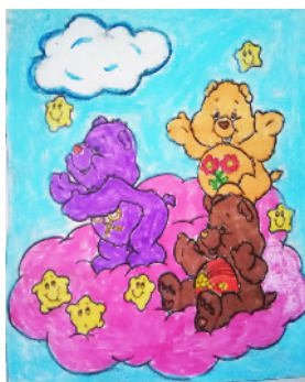
东城区实验学校 一(7)班 陈羿硕