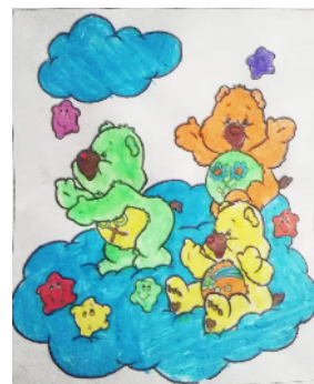
禹州市鸿畅镇朱屯小学 二年级 田洋嘉