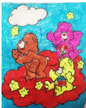
鄢陵县外国语小学 二(2)班 黄昭仪