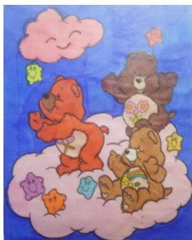
魏都区实验学校 三(7)班 刘梓涵