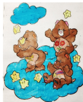
市健康路小学 三(9)班 王岩