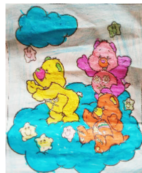
市大同街小学 三(1)班 朱瑞琳