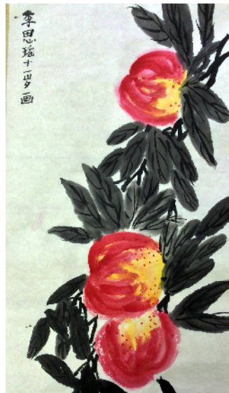
禹州市韩城西街小学 五(3)班 李思瑶 (辅导老师 刘朝锋)