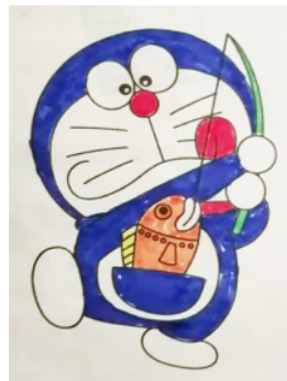
市南关村小学 五(2)班 王子睿