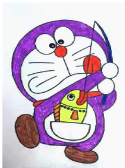
市光明路学校 一(6)班 武玫西