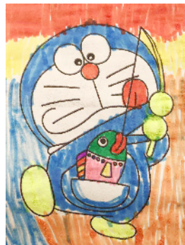
许昌双语实验小学 二(2)班 颜子垚