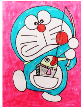
市光明路学校 一(6)班 白茗曦