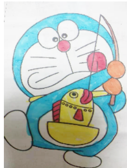
建安区实验小学 三(4)班 李成一