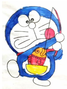
市府街小学 二(5)班 王琳涵