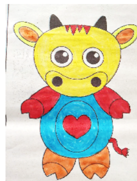
许昌市阳光学校 四(2)班 寇景文