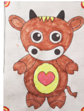
市学府街小学 三(2)班 姚雨诺