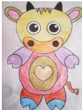
市建设路小学 一(2)班 武子焯