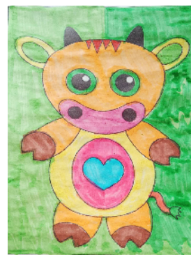
市八一路小学 四(3)班 王瑞琪