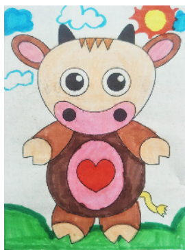
东城区实验学校 五(1)班 孙怡婷