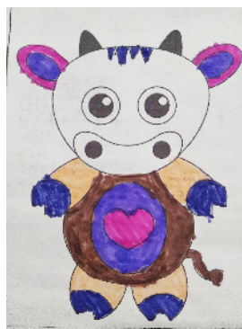
市健康路小学 一(9)班 刘以巧