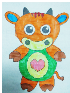
许昌实验小学 一(2)班 马若琪