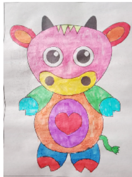
市南关村小学 二(1)班 谢艺彤