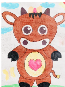
市光明路学校 一(6)班 白茗曦