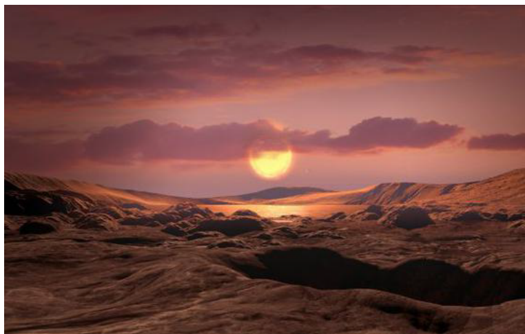
艺术家描绘的 Kepler-1649c, 它环绕一颗红矮星运行, 距离地球 300 光年。