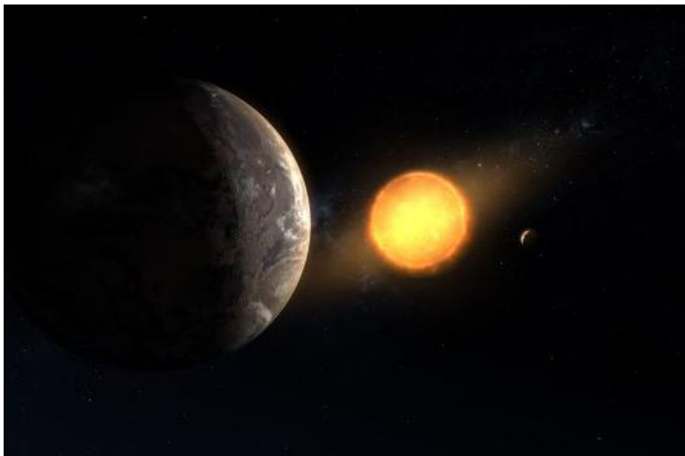
它位于恒星“宜居带”, 即液态水可能存在于地球表面的合适距离。