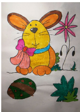
市学府街小学 三(1)班 赵姬尘