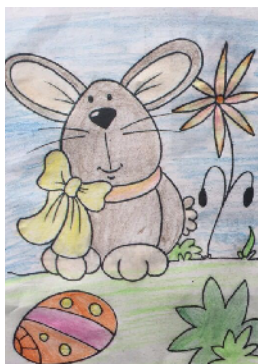
市建设路小学 二(2)班 李欣宇