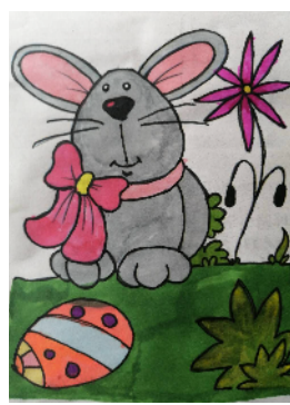
市学府街小学 二(7)班 温佳其