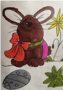
市古槐街小学 一(1)班 弓子芙