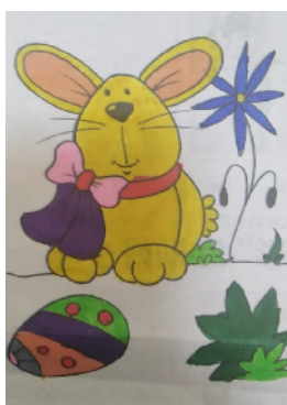
市毓秀路小学 三(9)班 张晴