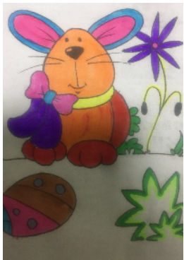
市健康路小学 五(7)班 余卓轩