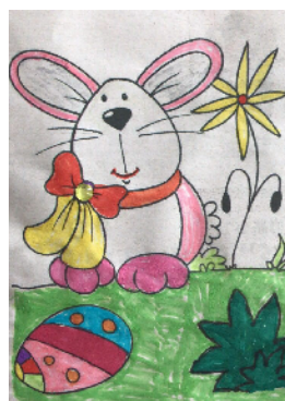
市建设路小学 二(6)班 张语晗