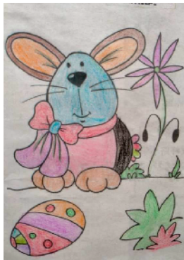
市健康路小学 三(6)班 孙嘉睿